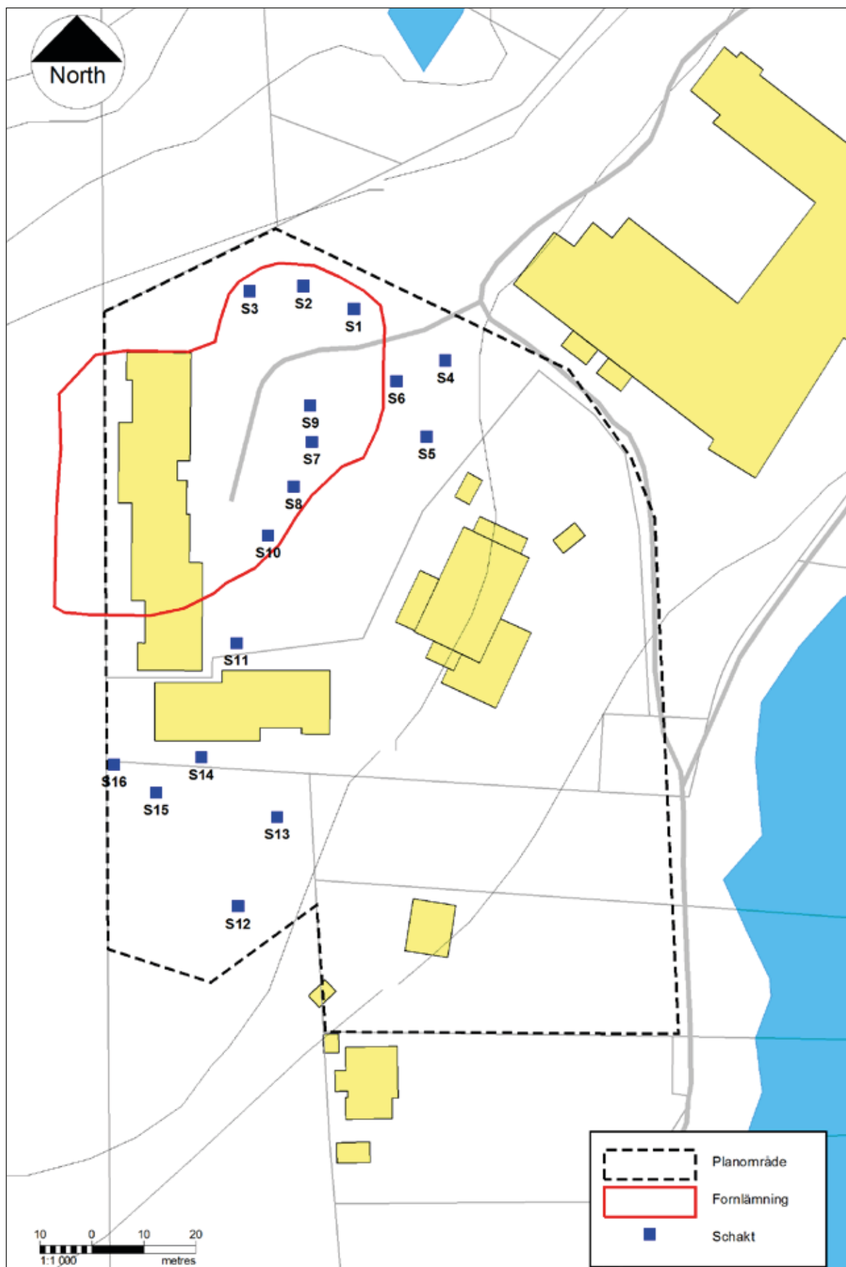
Figur 4. Fornlämningens utbredning efter den avgränsande förundersökningen, med schakt markerade. Skala 1:1000.