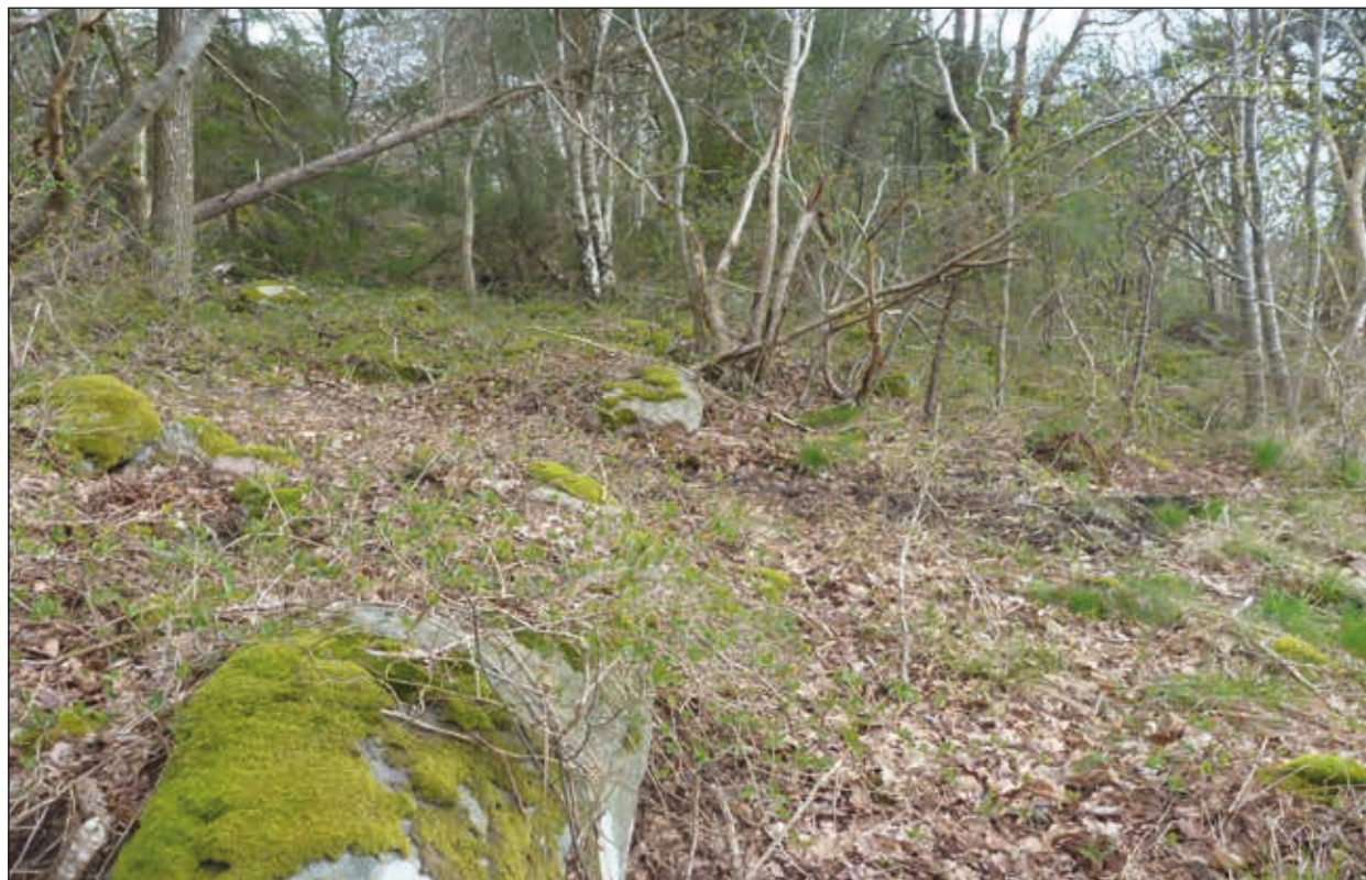
Figur 5. Område med storblockig morän som avgränsar fornlämningen norrut. Vy mot nordost.

Slagen flinta påträffades i nio av de undersökta schakten (S1-3, 8-11, 13 och 16). I S11, 13 och 16 framkom enstaka flintor, huvudsakligen i matjorden eller i störda kontexter. De sju fyndtomma schakten (S4-7, 12, 14-15) var i stor omfattning störda av sentida aktiviteter (bilaga 1).