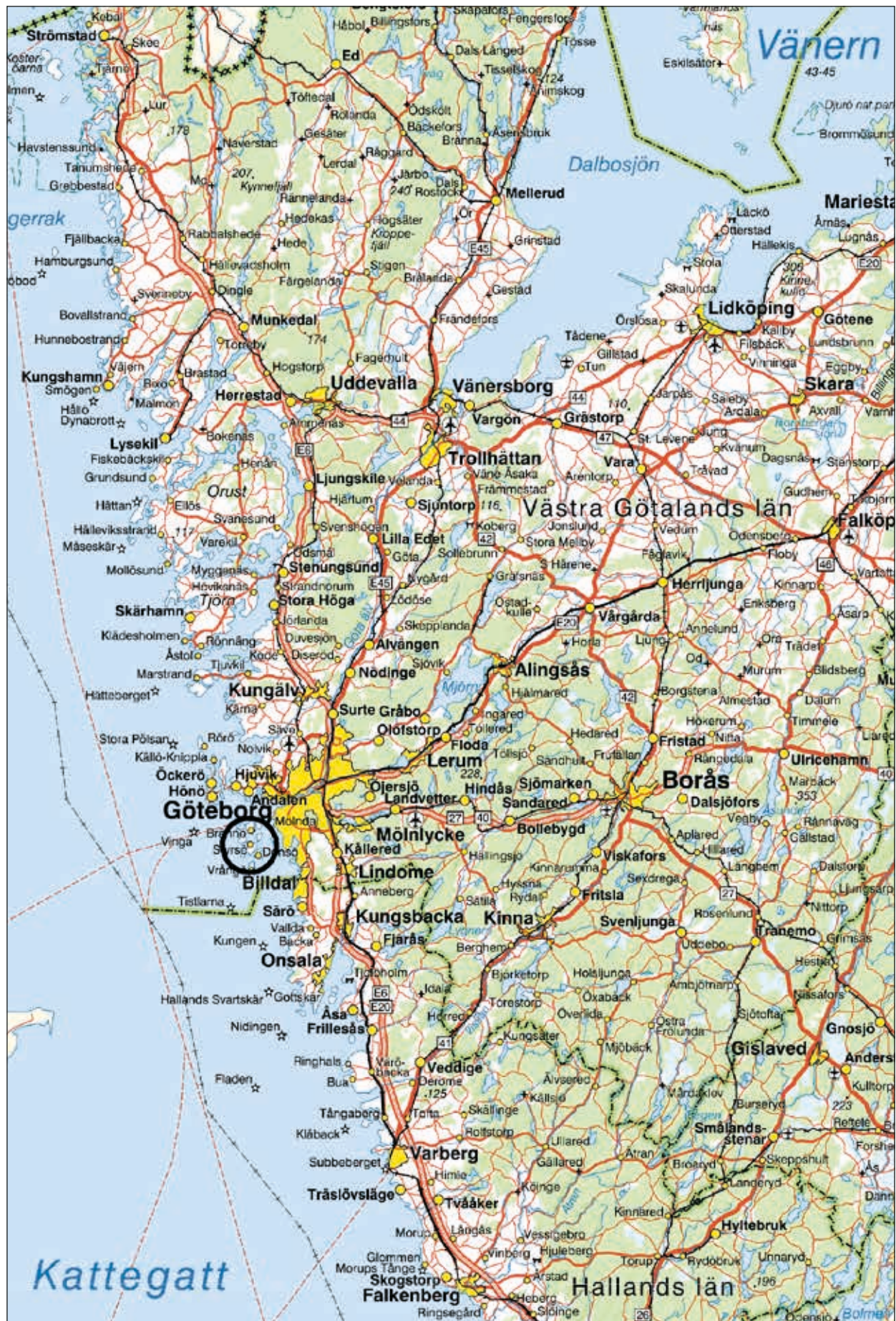
Figur 1. Översiktskarta med undersökningsområdet markerat (ring). Skala 1:1 000 000.