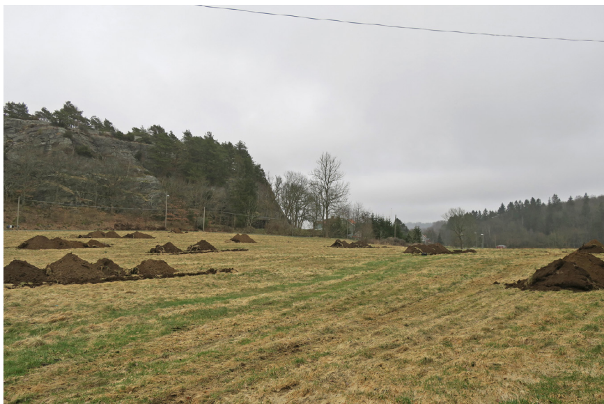
Fig 1. Undersökningsområdet mot Ö. Till vänster i bakgrunden syns Stuguåsen.