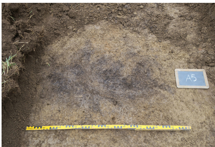
Fig 6. Sotfläck A5. Foto mot SO.