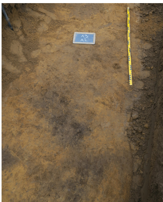
Fig 3. Sotfläck A2, foto mot SO. Mörkfärgningen A3 undersöktes och avskrevs.