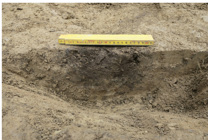
Fig 9. Mörkfärgning A8 i profil, möjligt stolphål. Foto mot SO.