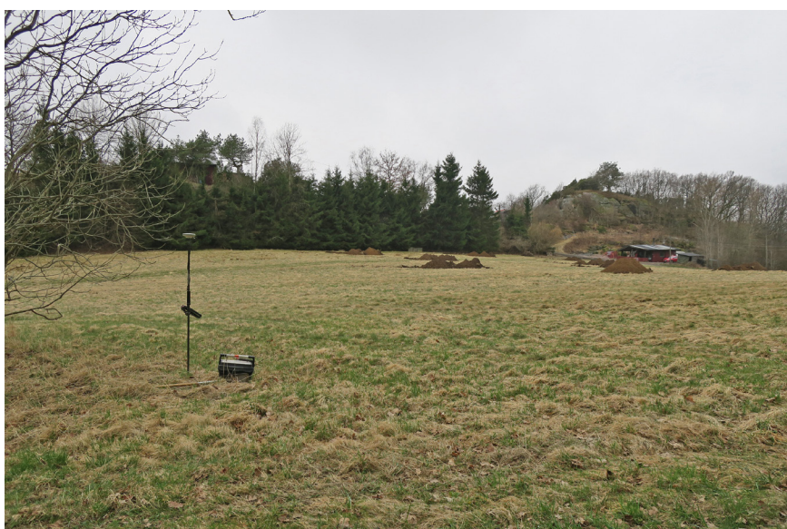
Fig 2. Undersökningsområdet mot V. I bakgrunden syns Lilleråsen. Den befintliga utsträckningen av Angered 50 är belägen på gräsytan närmast i bild.