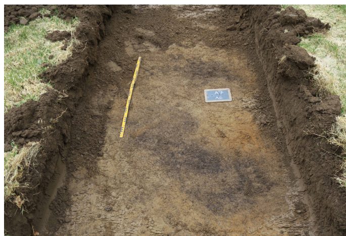
Fig 7. Sotfläckarna A6 (nederst) och A7 (överst). Foto mot SO.