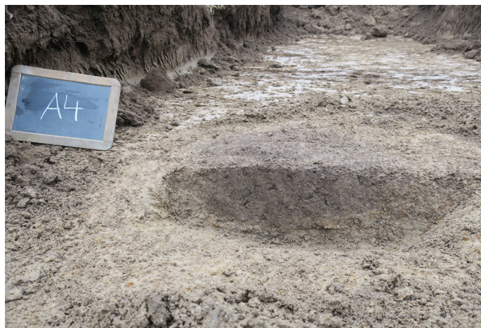
Fig 5. Mörkfärgning A4 i profil, möjligt stolphål. Foto mot SO.