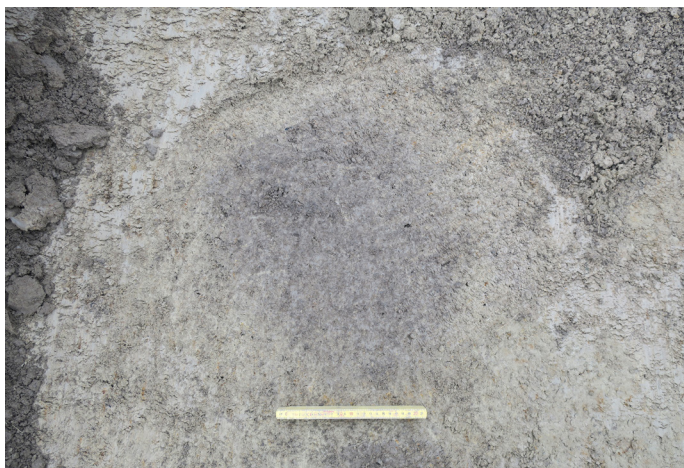
Fig 4. Mörkfärgning A4, möjligt stolphål. SO är uppåt i bild.