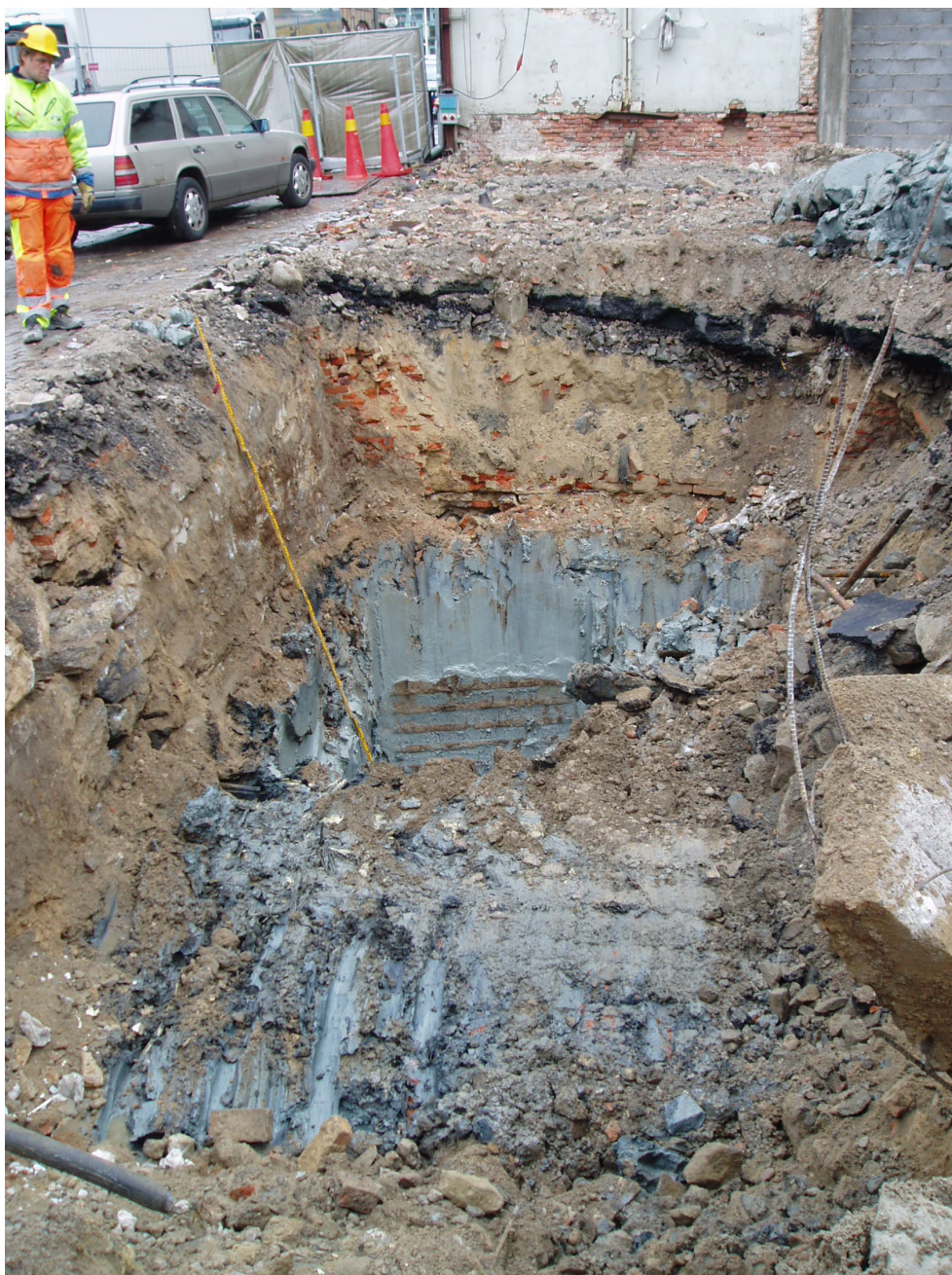
Figur 9. Översikt över schakt 6, sydvästlig riktning.

Inom undersökningsområdet påträffades inga rester av 1600 – 1700-talsbebyggelse. Ej heller påträffades något äldre fyndmaterial.