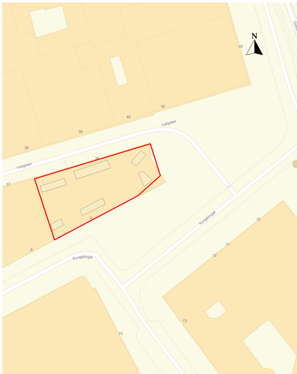
Figur 3. Översiktskarta över kv. Idogheten och närliggande fastigheter. Undersökningsområdet och sökschakt markerade. Skala 1:500.