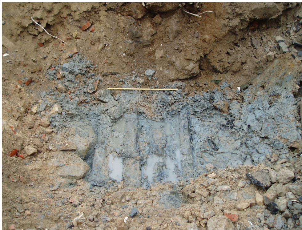
Figur 7. Vertikalt placerade rustbäddstimmer under fyllnadsmassor. Riktning mot syd.