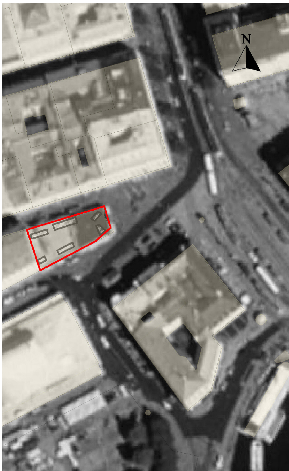
Figur 2. Ortofoto från 2002 över kv. Idogheten och närliggande fastigheter, undersökningsområdet och sökschakt markerat. Skala 1:1000.