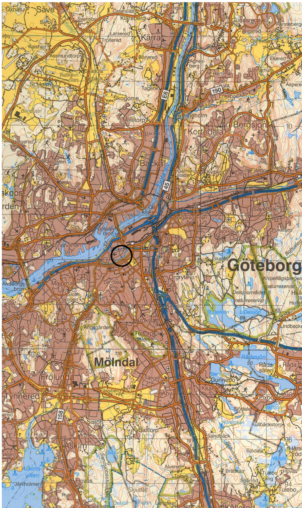
Figur 1. Undersökningsområdets läge i centrala Göteborg. Blå kartan. Skala 1:100 000.