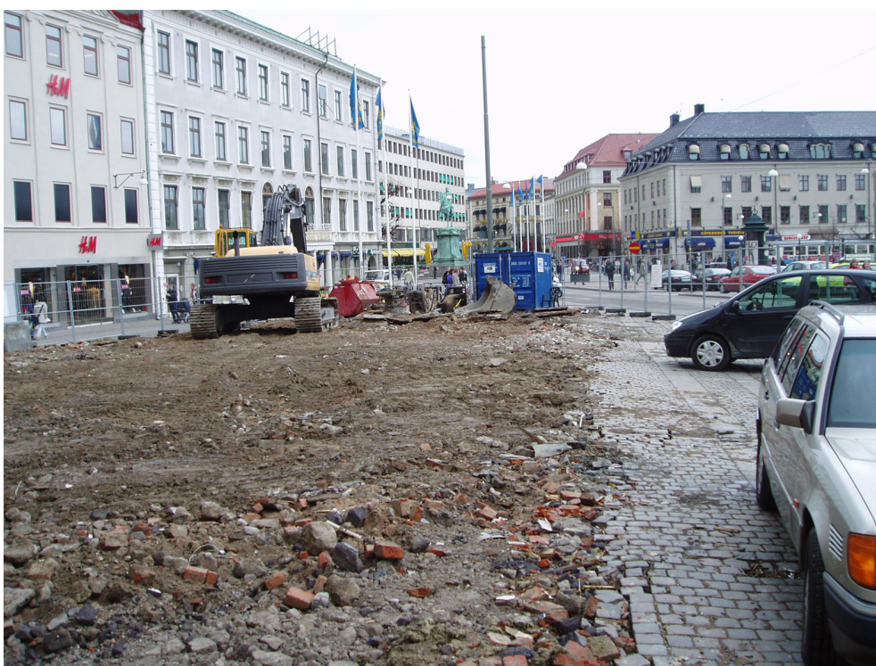
Figur 5. Översiktsbild över undersökningsområdet, nordöstlig riktning.

Inga naturvetenskapliga analyser utfördes.