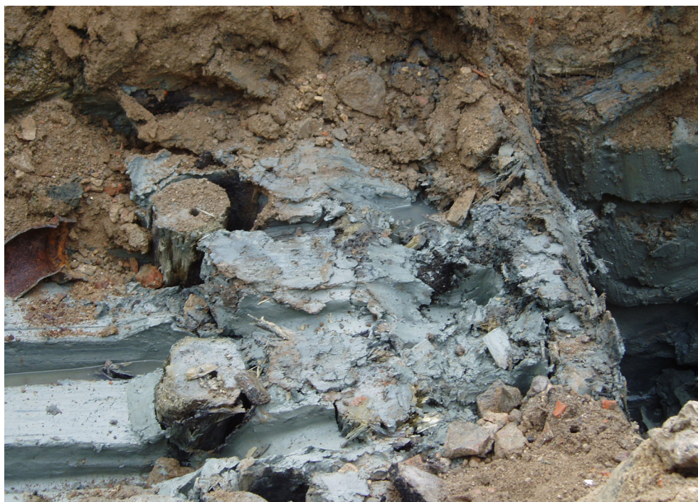
Figur 8. Del av rustbädd bestående av neddrivna timmerpålar. Riktning mot väst.