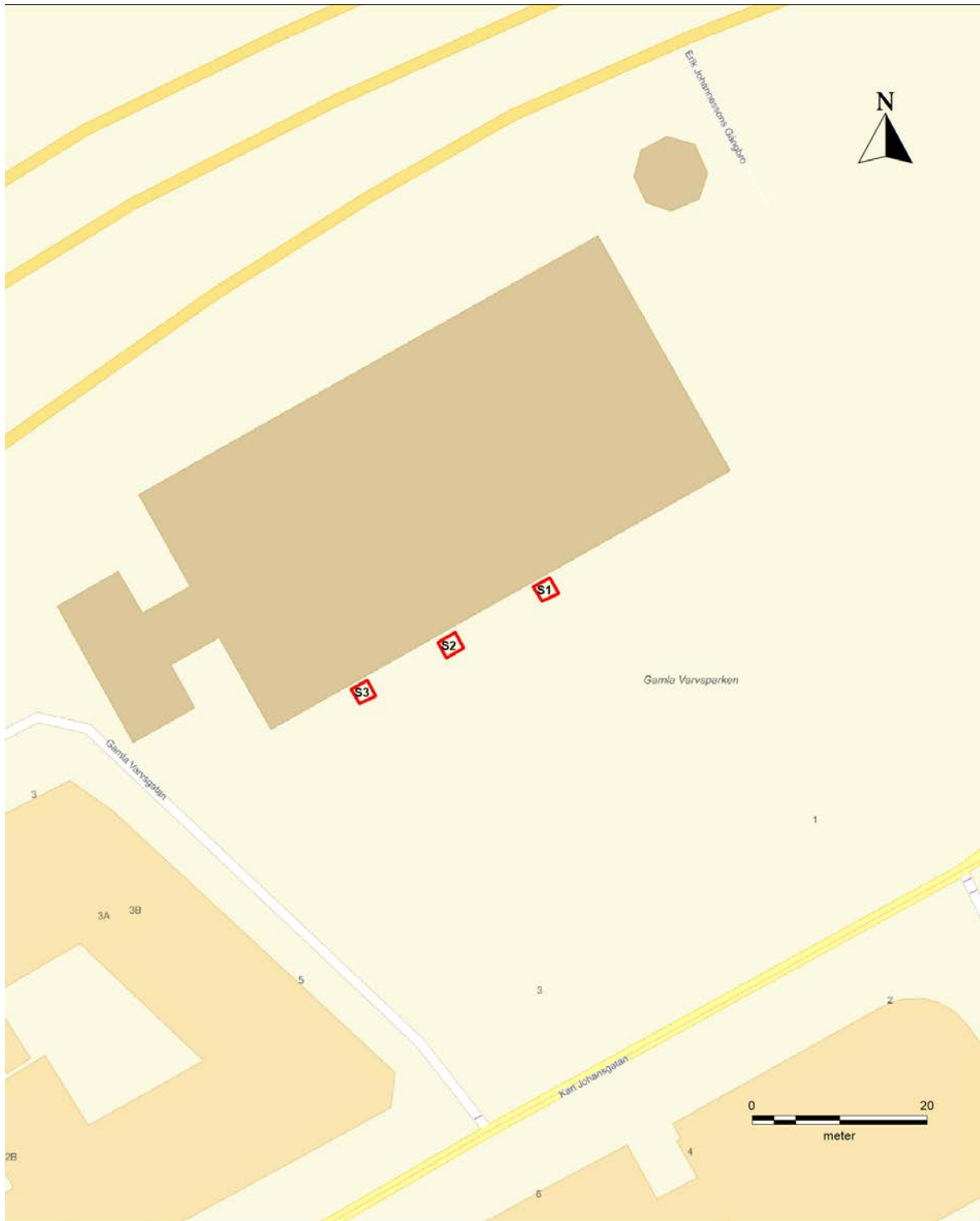
Figur 2. Fastighetskarta med provgropar markerade. Skala 1:500.