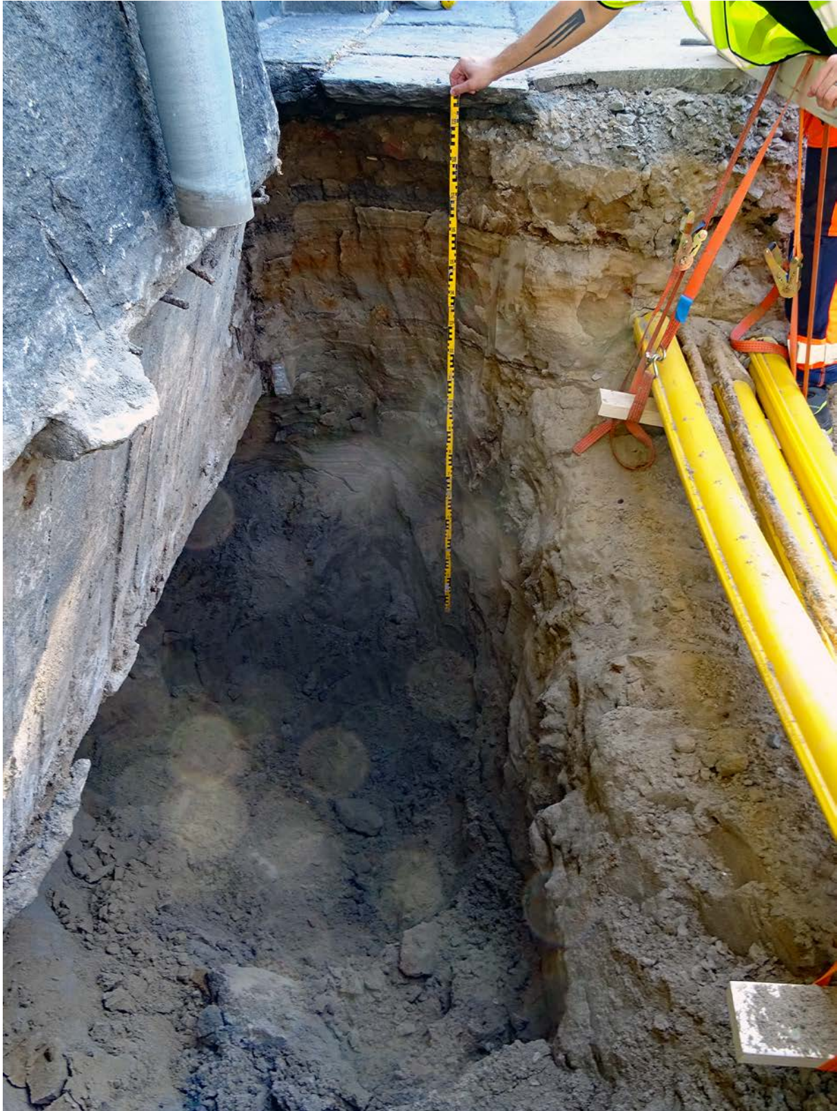
Figur 4. Provgrop 4 med fyllnadsmassor och naturligt avsatta sandlager i profilen. Foto mot nordost.