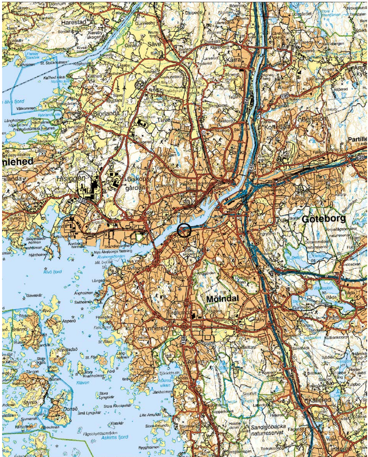
Figur 1. Undersökningsområdets läge i centrala Göteborg. Blå kartan. Skala 1:100 000.