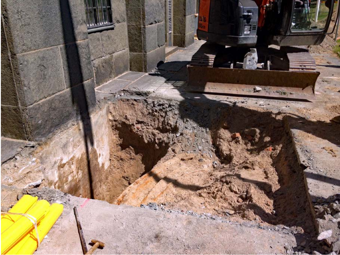
Figur 5. Översikt schakt 2. Foto mot nordost.