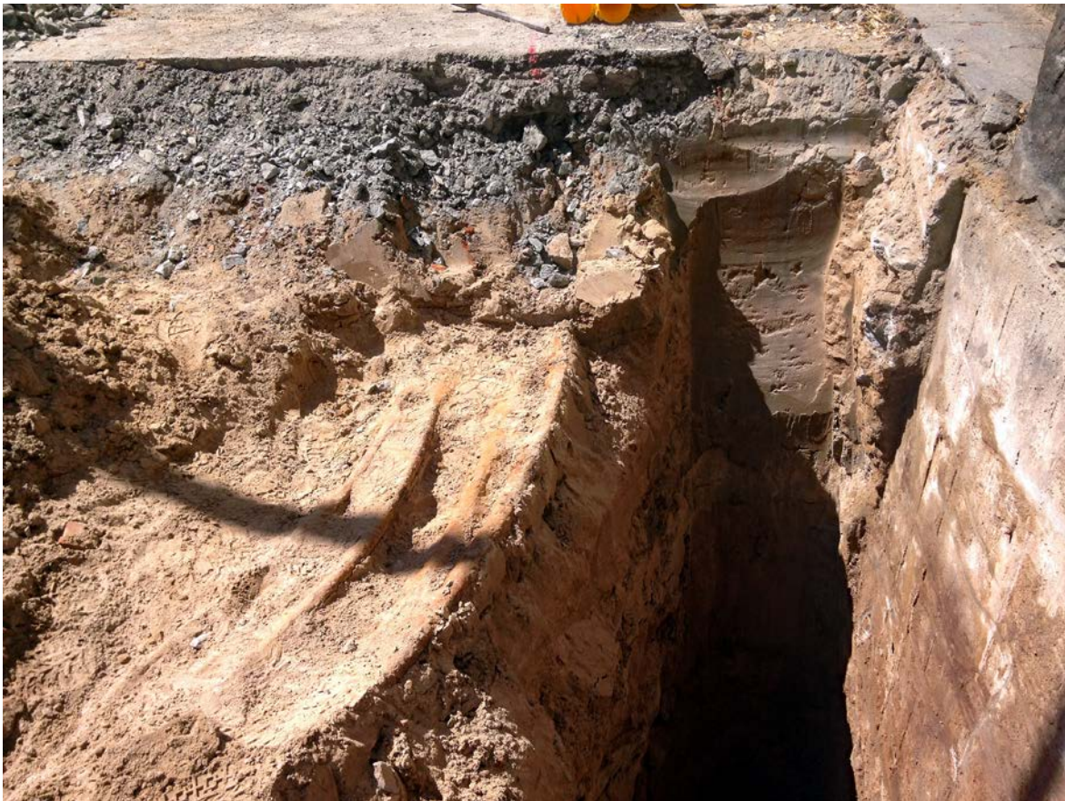
Figur 6. Frilagda kablar och recenta fyllnadsmassor intill husgrunden. Foto mot väst.