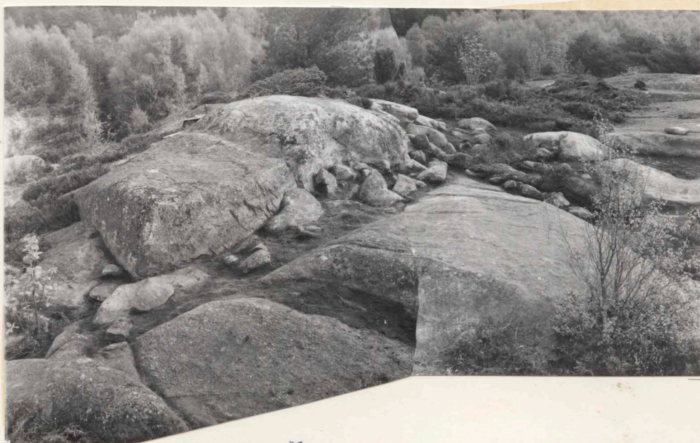
neg.nr. (X9: 7025) B 2499 4. Anläggningen efter avtorvning och rensning, från V.