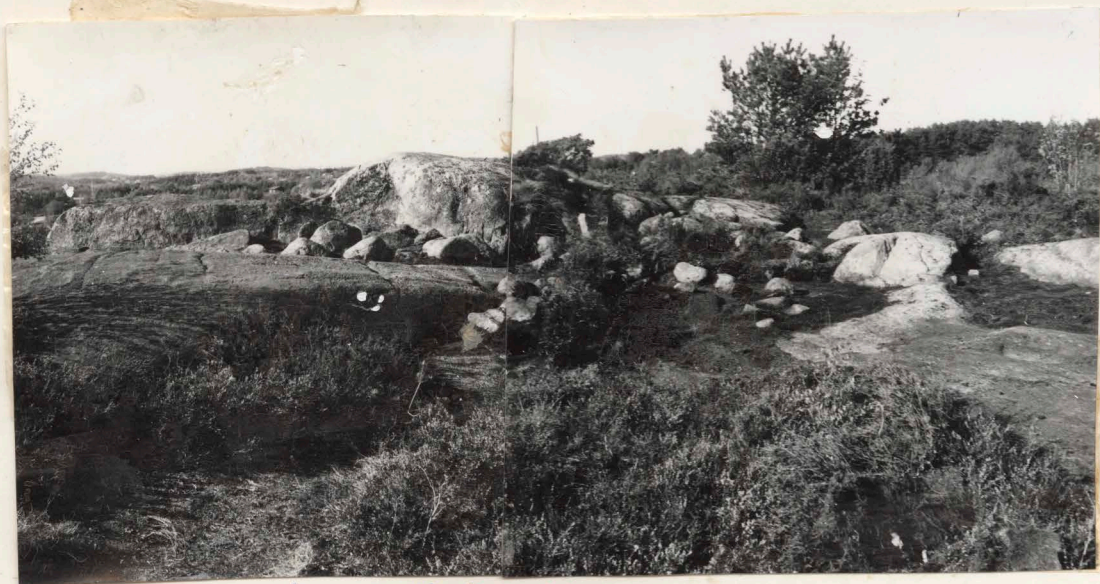
neg.nr. (X4: 7024) B 2498 3. Anläggningen efter avtorvning och rensning, från SÖ.