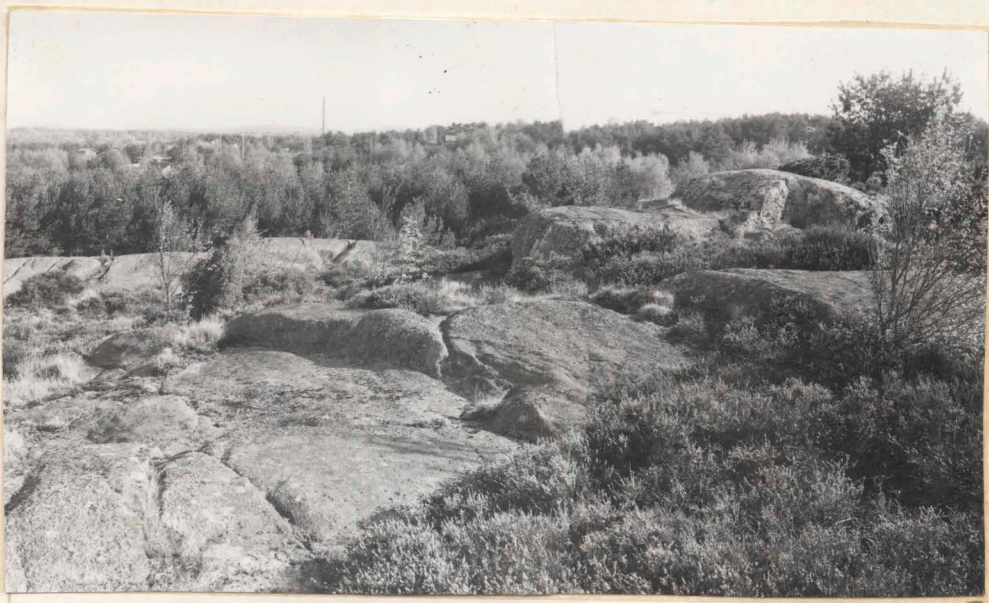
Neg.nr. (44:7023) B 2497 2. Anläggningen före påbörjad undersökning, från SV.