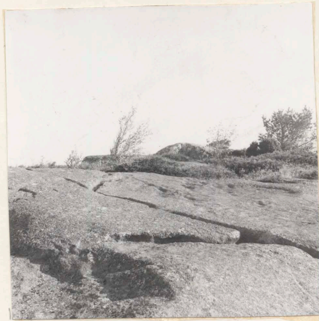
Neg.nr. (44:7022) B 2496 1. Anläggningen före påbörjad undersökning, från SV,