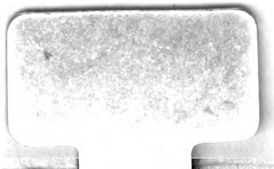
Fig. 27525 f. 802