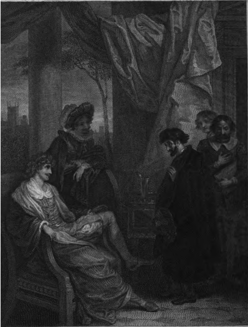
Smirke R.A. pinx t