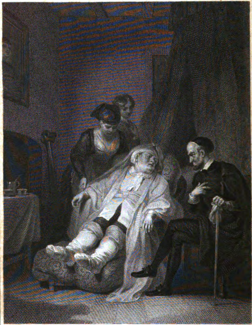
R. Smirke R.A. pinx t