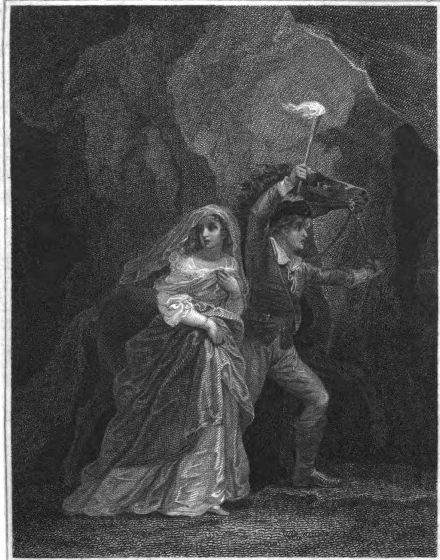
R. Smirke R.A. pinx