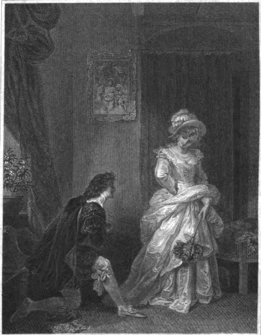
R. Smirke R.A. pinx.