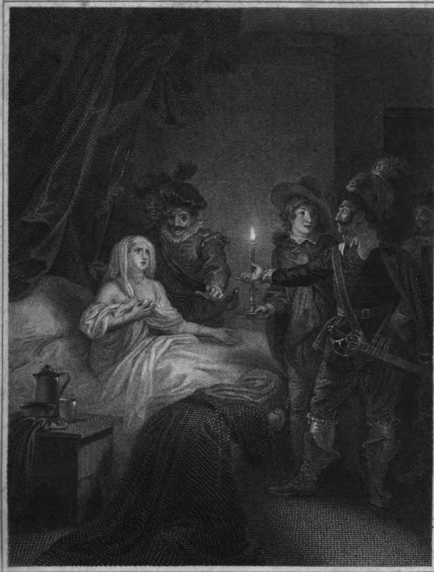
R. Smirke R. A. pinx t