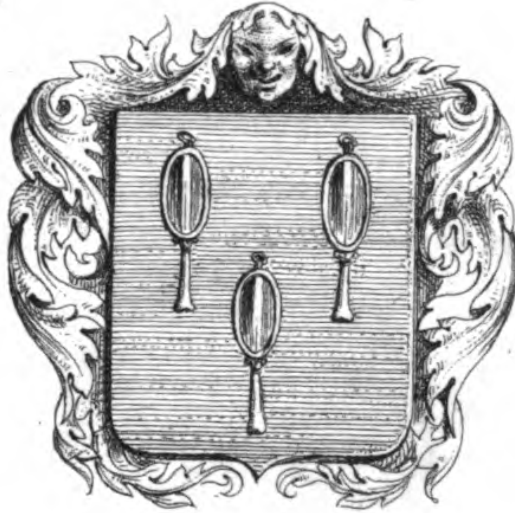
Armoiries DE MOLIÈRE