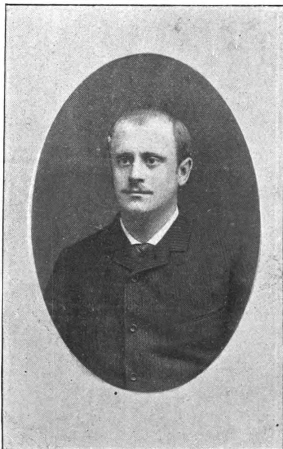
STANISLAS DE GUAITA A DIX-NEUF ANS