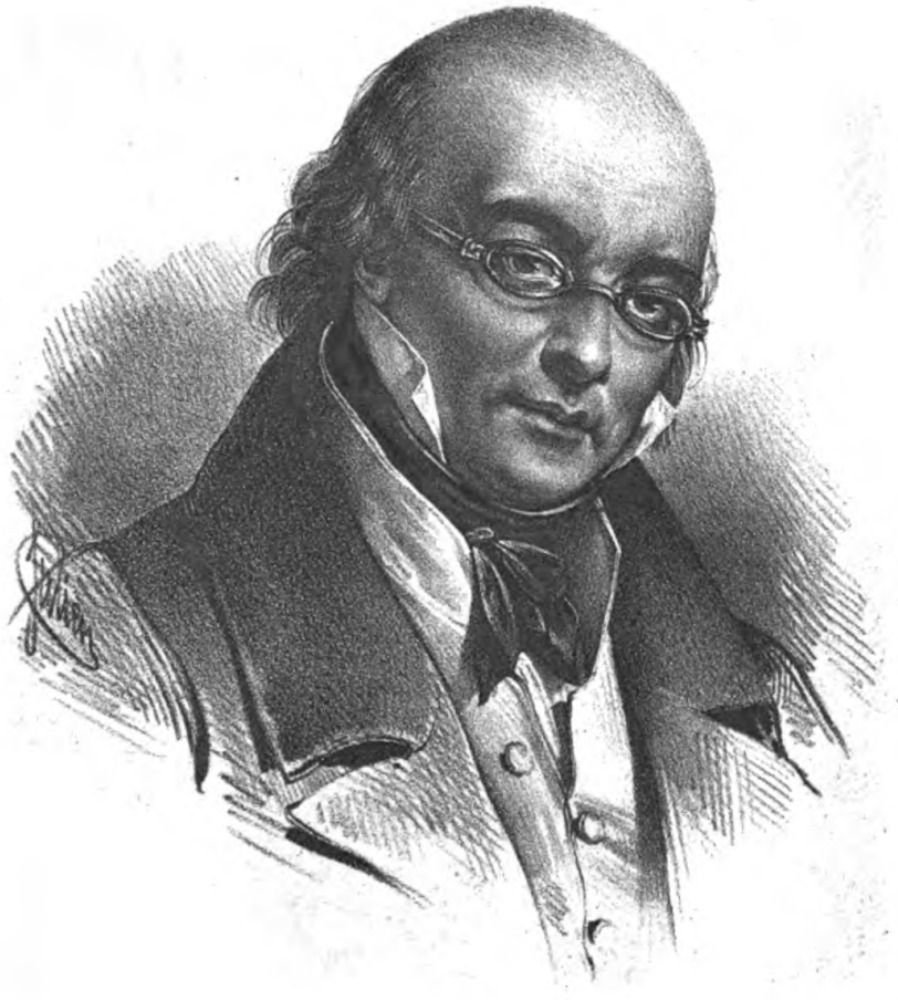
P. J. DE BÉRANGER