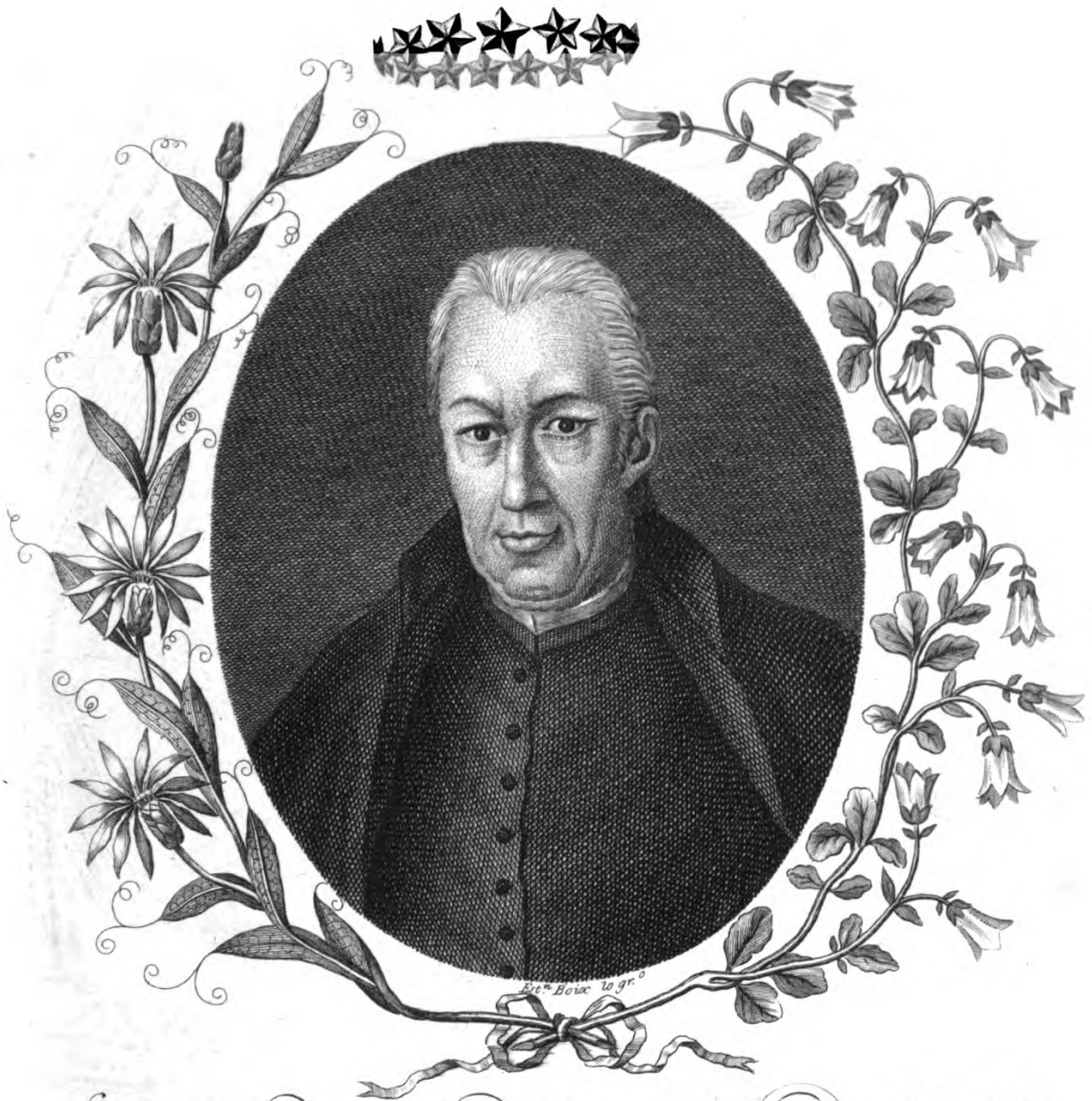
Dr. Jose Celestino Mutis Director en Jefe de la Expedición Botánica en el Nuevo Reyno de Granada y, Astrónomo Real en Sta. Fe de Bogotá. Copiado del original que le dedicaron sus amigos ALEJANDRO HUMBOLD , y AMATO BONPLAND en el Tom. 3. o de las Plantas Equinocciales .