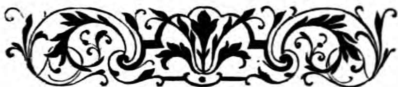
TABLEAU HISTORIQUE ET CRITIQUE DE LA POÉSIE FRANÇAISE ET DU THÉÂTRE FRANÇAIS AU XVI e SIÈCLE.