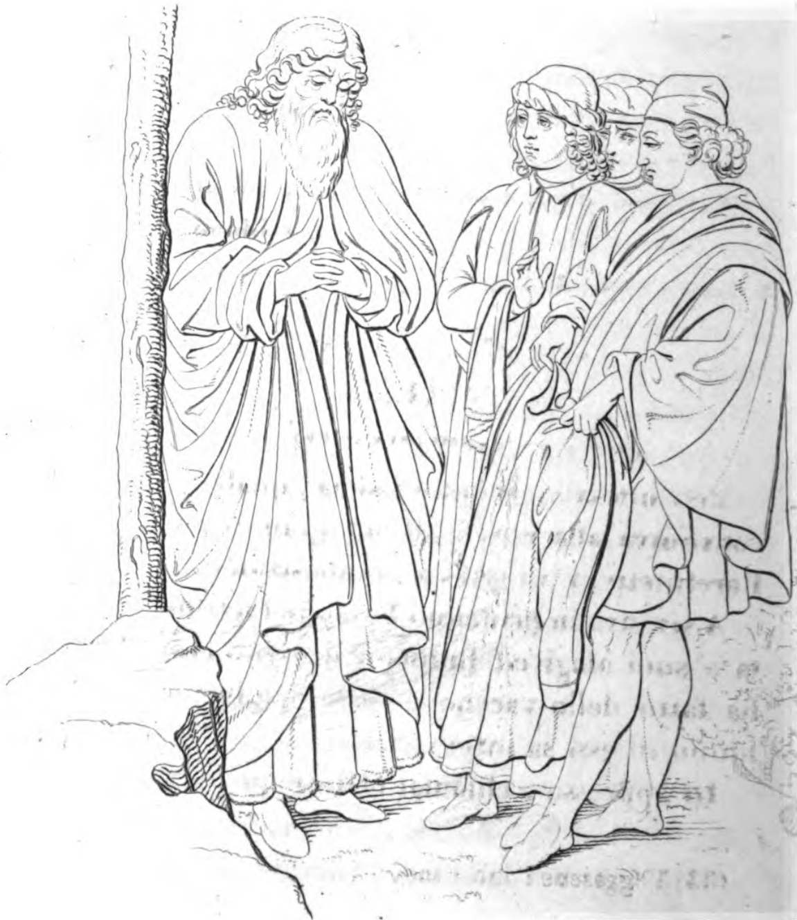
S. o T. Saul.