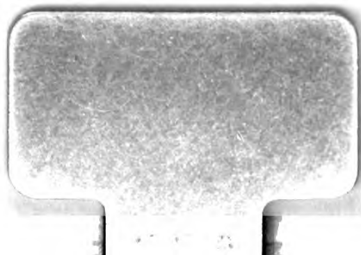
Fig. 27526 f. 65