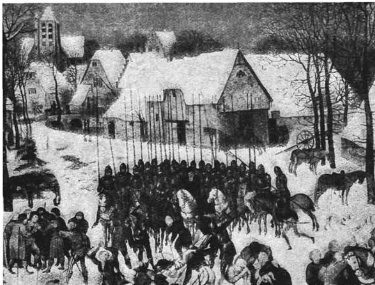
(Kunsthistorisches Museum, Vienne.)

Jusque-là, les provinces catholiques du Sud, ballottées entre leur loyalisme et leur patriotisme, aussi impressionnées par les excès des sectaires calvinistes que par ceux de la soldatesque espagnole, n'avaient pas réagi aux diverses tentatives dirigées par le prince d'Orange pour les joindre à la révolution, opérer l'union des catholiques et des calvinistes sur un programme national et créer la « commune patrie ». La crise traversée pendant l'été de 1576 par le gouvernement général espagnol et par l'armée, épuisée et laissée sans solde, permit de ressouder les deux tronçons des XVII Provinces. A l'initiative des Etats de Brabant, les Etats généraux se constituèrent en gouvernement régulier et levèrent une armée nationale. A ce moment précis, le gigantesque pillage d'Anvers par les troupes espagnoles impayées (connu sous le