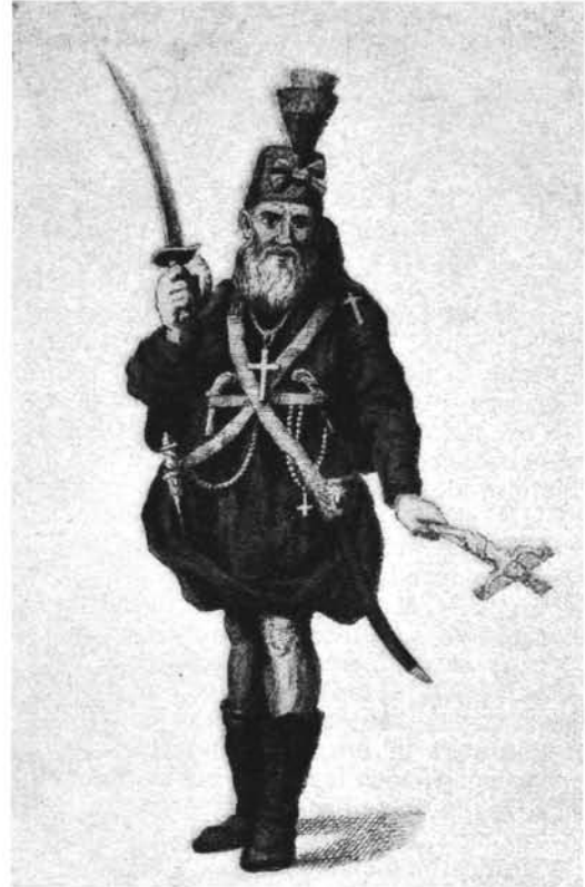
(Musée de l'Armée, Bruxelles.)

de Léopold II. Quelques semaines après, le front de combat, établi au Sud-Est de Namur, plie à la première attaque, le Congrès souverain s'effondre et les Autrichiens réoccupent Bruxelles. La révolution réactionnaire était morte. En même temps qu'elle, succombait la révolution liégeoise, beaucoup plus étroite