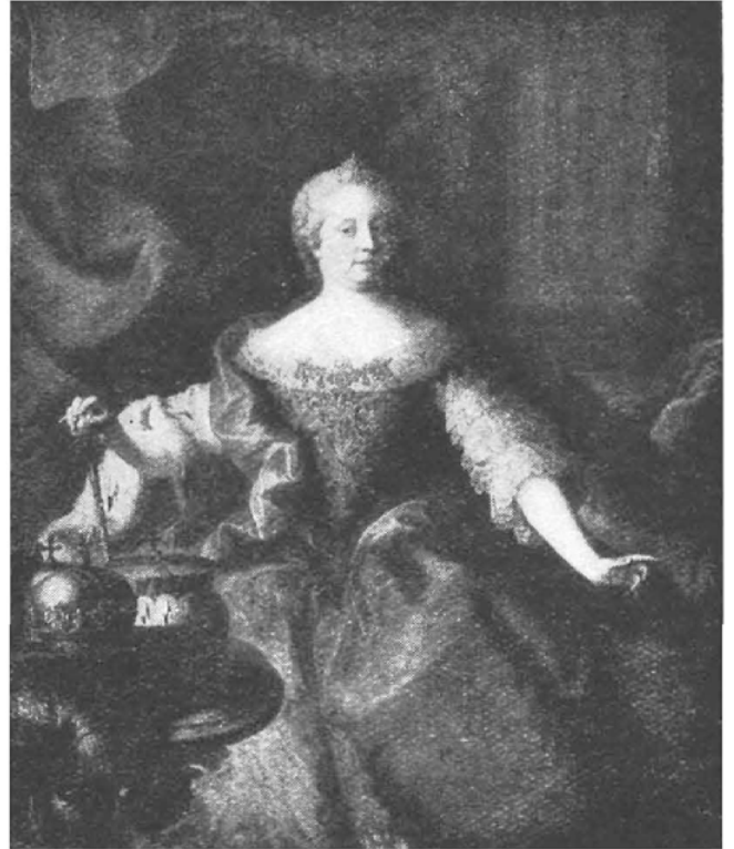
(Musée des Beaux-Arts, Bruxelles.)

Le relèvement économique des Pays-Bas s'exprime dans le chiffre d'accroissement de la population du XVII e au XVIII e siècle, qui est de l'ordre d'un million d'âmes. La moyenne