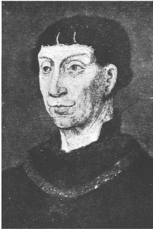
(Cabinet des Manuscrits, Bruxelles.)

Grand dans la diplomatie et dans la guerre, Philippe le Bon a été plus grand encore dans la paix. Il a pourvu ses états d'une solide armature d'institutions où les traditions régionales et les influences françaises se combinent en pleine harmonie : Conseil de Flandre (Cour suprême de justice), devenu en 1446 Grand Conseil (en même temps sorte de Conseil d'Etat), Chambre des Comptes , vaste organisme de contrôle financier et d'administration du domaine, et Chancelier , sorte de premier ministre. Cette machine administrative, fon-