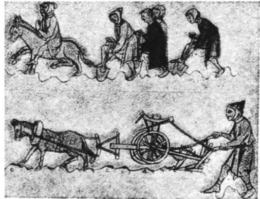
(Cabinet des Manuscrits, Bruxelles.)

Au XII e siècle, la Belgique devient le pays de villes qu'elle est encore. Cette économie urbaine a été, chez nous, le support d'une industrie qui a été la première grande industrie moderne de l'histoire : la draperie urbaine. Elle produit des tissus de luxe et les exporte en masse à grande distance, en Allemagne, en France, en Italie et jusqu'en Orient. Les conditions toutes nouvelles de l'impor-