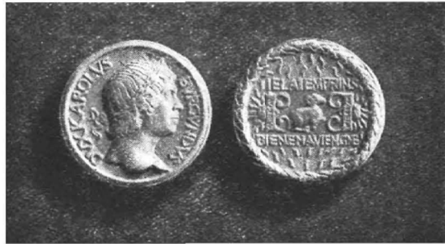
(Cabinet de Médailles, Bruxelles.)

une armée permanente, dont les unités sont la lance et la compagnie d'ordonnance, organise la plus puissante artillerie du monde, et augmente sans cesse le trésor de guerre. Il ne se contente plus de dominer sur la Meuse, il pousse vers le Rhin, et surtout de la Franche-Comté vers l'Alsace et la Suisse. Il nourrit le projet grandiose et plein de clairvoyance, d'unir dans ses mains les rênes de tous les pays d'entre-deux, de la mer du Nord aux Alpes, peuplés d'éternels mécontents par tradition historique. Mais à cette visée très raisonnable se mêlent les nuées de plans grandioses de reconstitution de la Lotharingie du IX e siècle, où se perd la notion de l'utile et du possible. Enveloppé dans les toiles d'araignée de la diplomatie de Louis XI, en lutte avec les Etats généraux qui lui refusent les subsides nécessaires, lâché