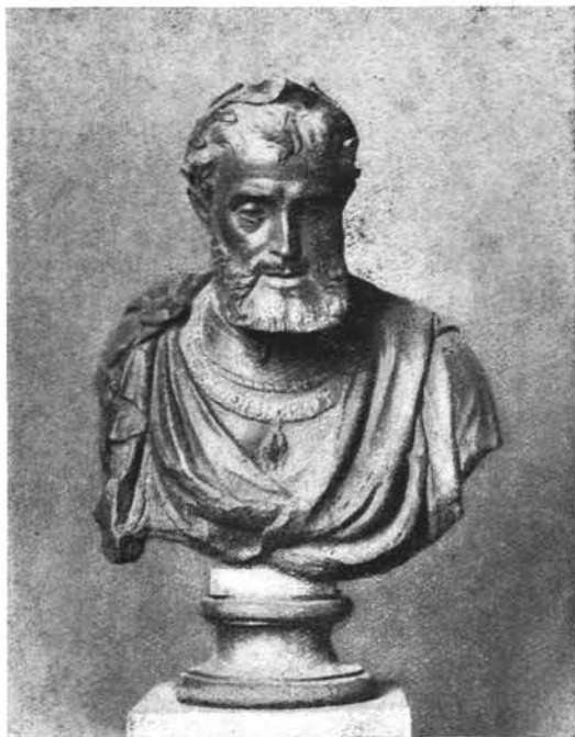
(Musée des Beaux-Arts, Bruxelles.)

A cet égard, malgré certaines apparences, le règne de Charles-Quint continue plutôt l'ère bourguignonne. Elevé à l'âge de vingt ans, par un prodigieux concours de circonstances, à la tête de l'empire le plus étendu qu'on ait vu dans l'histoire, puisqu'il régnait à la fois sur les Pays-Bas l'Empire, le royaume des Deux-Siciles, la péninsule ibérique et le Nouveau-Monde, Charles-Quint est demeuré, pour nos provinces, un « prince naturel », instruit par des maîtres et entouré de conseillers flamands et bourguignons, et qui faisait aux Pays-Bas une place privilégiée dans ses innombrables préoccupations. Certes, il les a exposés aux invasions des armées de