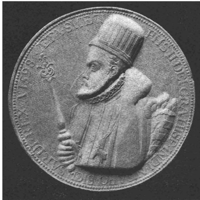
(Cabinet des Médailles, Bruxelles.)

L'exploitation capitaliste, en pleine formation, accuse déjà de graves conséquences pour le niveau de vie des travailleurs, d'autant plus que l'afflux des métaux précieux d'Amérique détermine une crise des prix qui frappe en premier lieu les salariés. Elle n'est pas étrangère à la naissance d'une mystique