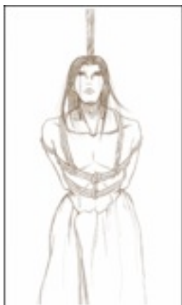
Slika 1: tsurushi ageru – obesiti i „okačiti” u japanskom kulturološkom kontekstu

Da bismo razumeli o kakvoj se situaciji radi, te da ne bismo mešali interpretaciju sa klasičnim značenjem srpskih glagola „obesiti” i „visiti”, koji podrazumevaju vid egzekucije, a ne nužno i sramoćenja, prilažemo odgovarajuću ilustraciju: