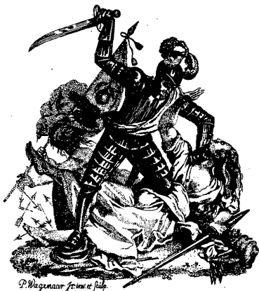
P. Wagenaar fecit et sculp.