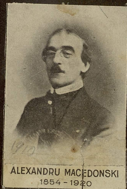
1910 ALEXANDRU MACEDONSKI 1854 - 1920