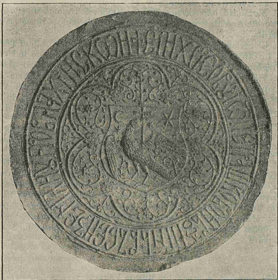
Matricea peceții lui Pătrașcu Vodă găsită în pământul Ardealului (v. p. 93), ghips după originalul aflător în muzeul din Cluj.