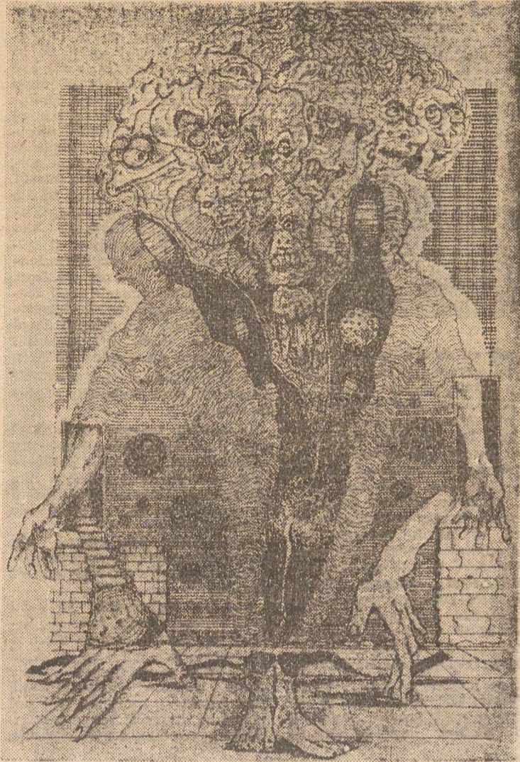
• Grafică de ILIE PAUL.