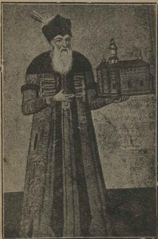
MIRON COSTIN Portret mural in biserica de la Todireni