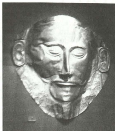
Masca lui Agamemnon