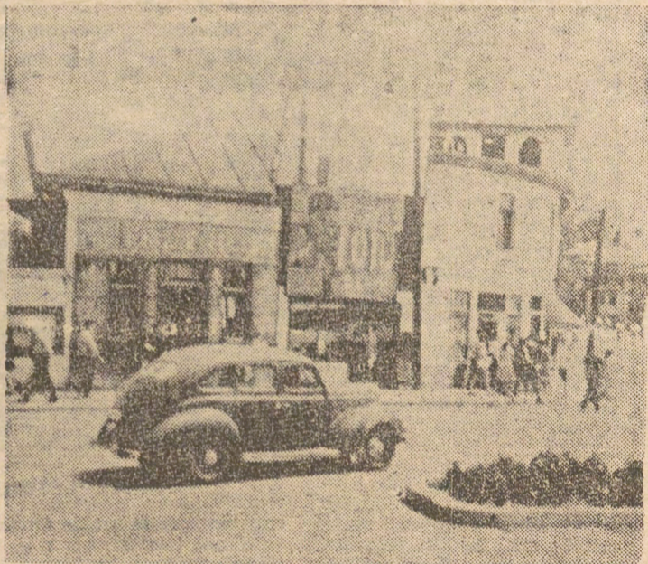
• Bacăul de tranziție.