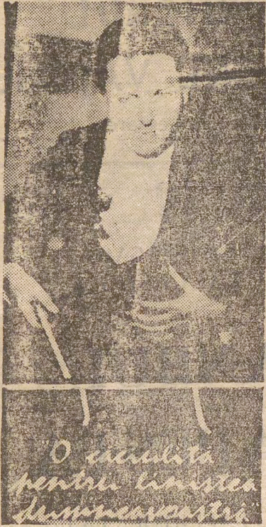
● George Enescu (1939)

Rareori la oameni — fie că sunt artiști sau nu — întâlnim o totală unitate între structura psihică, comportamentul cotidian și creație. Enescu, exemplul de totală transparență, era unul și același în toate înfățișările și ipostazele sale. Începînd cu privirea lui pătrunzătoare, de un albastru ca oțelul, care impresiona și intimida pe oricine îndrăzne să-l privească în ochi, era în același timp privirea care vedea „unde dincolo” de hotarele minții și cunoașterii omului — obisnuit, dar și în lumea visului, era și privirea ce-