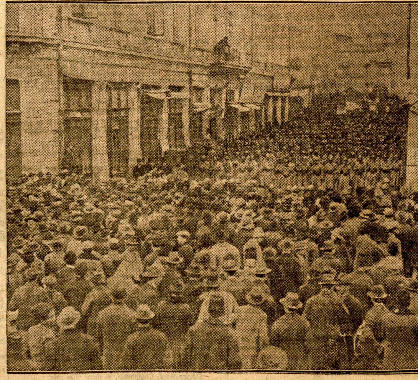
Cum se votează constituția