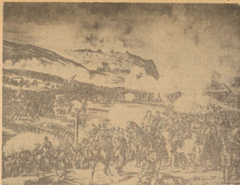
Capitularea Plevnei. Oștile lui Osman Pașa se predau generalului român Cerchez