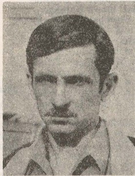
MIERLELE DE FUM ALE COPILĂRIEI

Se ia o frunză Pușin obtuză Și o petală Mai trivială, Pușin polen Ambigen Și o tulpină Felină; Totul se pune Cu un tăciune, Cu un trifoi În patru foi Și o cunună De mătrăgună — Se mestecă bine Pînă devine O dezgustătoare Și înfamă Licoare, Din care Se gustă pușin Și se exclamă: Divin!