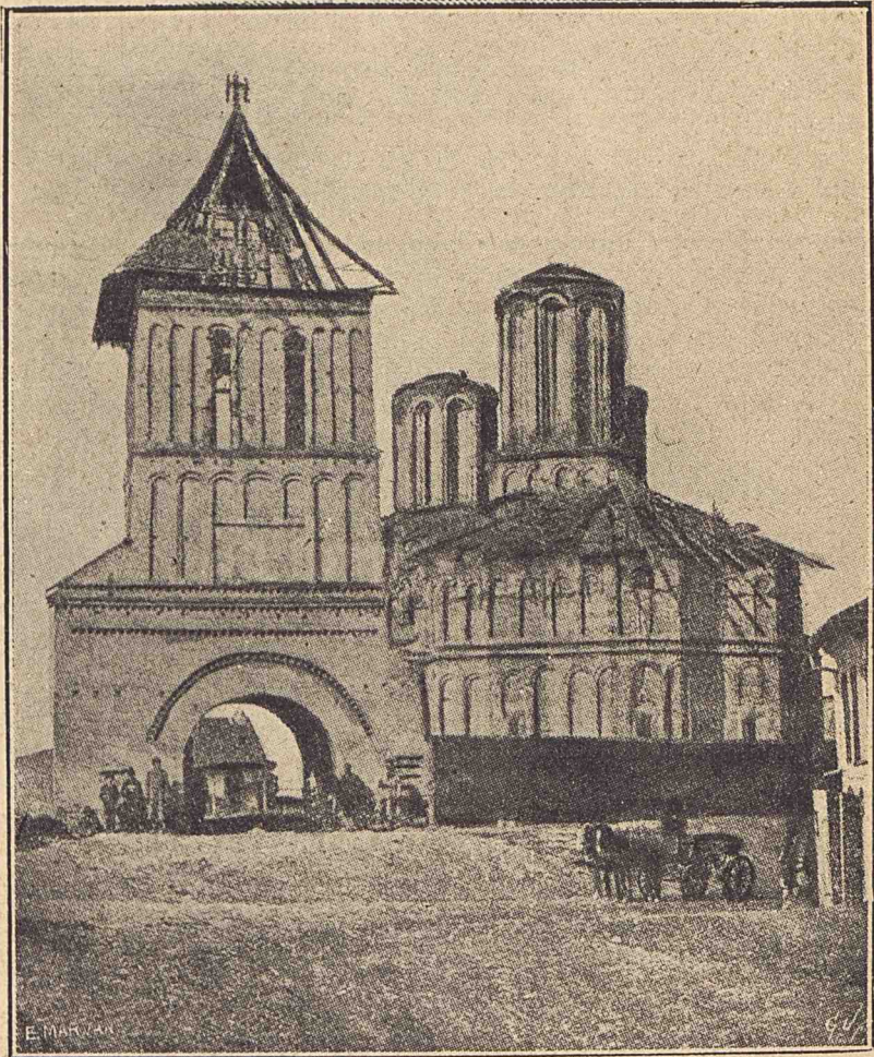
Biserica Sf. Dumitru cu clopotnița.

în călugărie), ori nepotul lor, Preda, fiu al lui Pârvu, Banul de subț Basarab Neagoe. Dar se știe că soția lui Barbu s'a făcut însăși călugăriță, luând numele de Salomia: această femeie evlavioasă poate fi deci ctitoarea Sf. Dumitru.