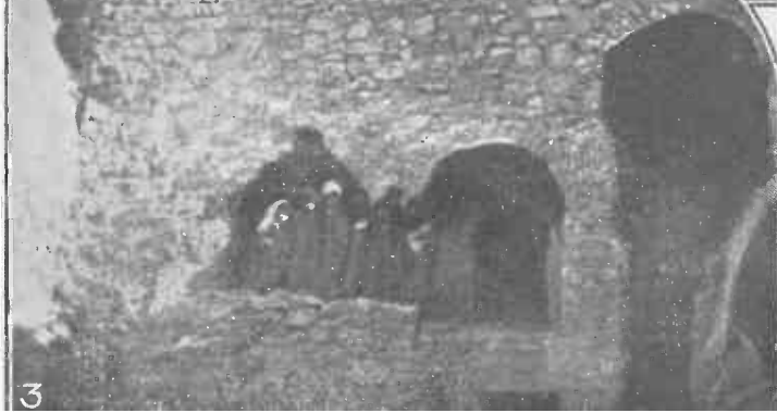
1. Vederea interiorului unei locuințe de Troglodiți. 2. Grup de Evrei troglodiți în fața sinagogii lor subterane.—3. Familia șei-culuf musulman la intrarea locuinței acestuia