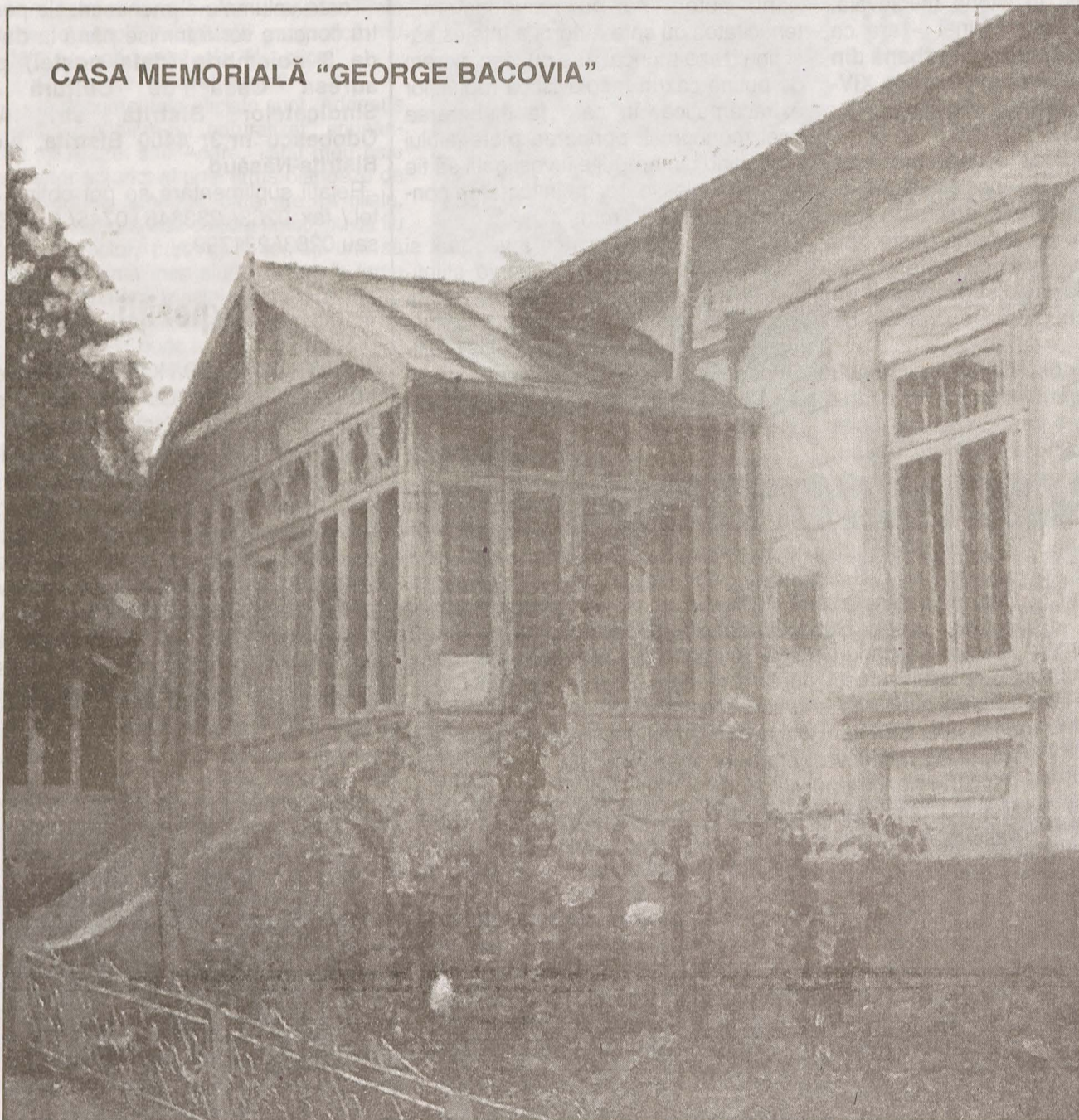
CASA MEMORIALĂ "GEORGE BACOVIA"