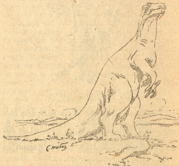
Fig. 8. Un Iguanodon.

Alți Dinosaurieni erbivori, neavând gâtul lung și pentru a putea rupe din frunzarul arborilor înalți, se rădicau pe labele dindărat. În acest caz acestea au luat o dezvoltare deosebită, iar pe