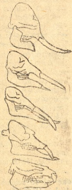
Fig. 14. Prefacerile scheletului de elefant (sus), dela cel mai vechiu neam al lui, cunoscut (jos).

Cu schimbarea climei, mamiferele capătă o altă răspândire. Bunăoară, a fost o vreme, pe la sfârșitul erei terțiare, când prin sudul Moldovei trăiau momițe, alătura de castori. Și unele și altele azi nu se mai găsesc pe la noi. Momițele sunt animale din ținuturi calde, pe când castorul abea se mai întâlnește în puține