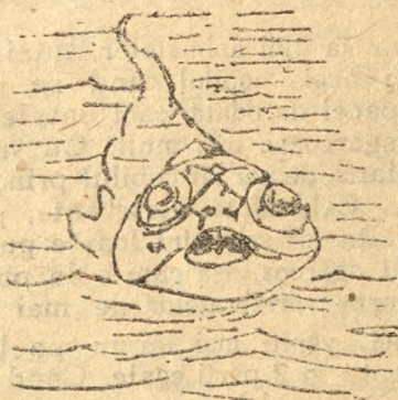
Fig. 1. — Un pește blindat.

perit sau cu solzi smălțuiți, ce le formau o adevărată zale, sau aveau adevărate scuturi ce le apărau jumătatea de dinainte a trupului. Erau cuirăstate vii, ca apărare împotriva unor raci uriași, cu clește la picioare, de puteau să sfarme orice scoică. E veșnica luptă pentru viață. Când Anglia și Franța își construiau un vapor de războiu modern, Germania, înainte de războiu, construia două, cu plăci și mai groase, nestrăpunse de obuzele dușmane.