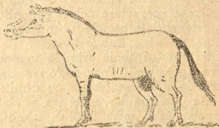
Fig 13. Strămoșul calului cu 3 degete la picioare.

la noi, scheletele lor găsindu-se în mare număr în depositele cu oase dela Taraclea, de lângă Tighina. Incetul cu încetul pe degetul cel din mijloc sprijinindu-se toată greutatea trupului, acesta se dezvoltă tot mai tare, iar cele două laterale tot se închircesc și astfel se ajunge la calul de azi, care are numai un deget. Ca semn că străbunii calului aveau mai multe degete, i-au rămas două osușoare subțiri, fără întrebuințare, sub pielea labei dar care sunt ciolănele ce susțineau degetele laterale ale strămoșului lui, după cum din vreme în vreme se nasc cai cu 2 sau 3 degete la picior.