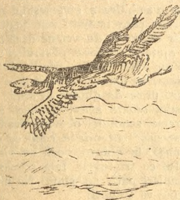
Fig. 12. Infățișarea celei mai vechi paseri.

dar nu ca o pasăre de azi, prea lung drum. Mai de grabă săvârșea un sbor planat, ca un aeroplan, de pe creanga unui copac înalt, pe alta mai joasă sau pe pajistea din piaonă. Mare emoție în lumea învățată a stârnit găsirea celei dintâi pene, în 1860, în vestitele calcaruri dela Solenhofen, cu bobul fin și din cauza aceasta atât de prețuite în arta litografiei. După un an, toate ziarele anunțau vestea, că s'a mai găsit și o parte din schelet. S'a pus preț mare pe el și s'a vândut cu 600 Pfd Sterling pentru British Museum din Londra. Era o avere întreagă pe acea vreme.