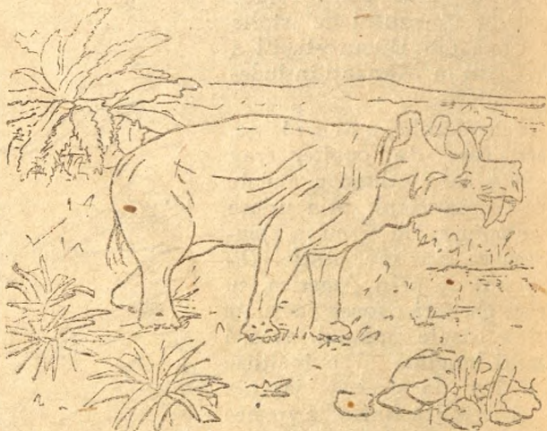
Fig. 15. Un mamifer din vremea terțiară.

Și în acest chip decorul de pe fața pământului mereu e în prefacere. Ființele nu rămân ace-