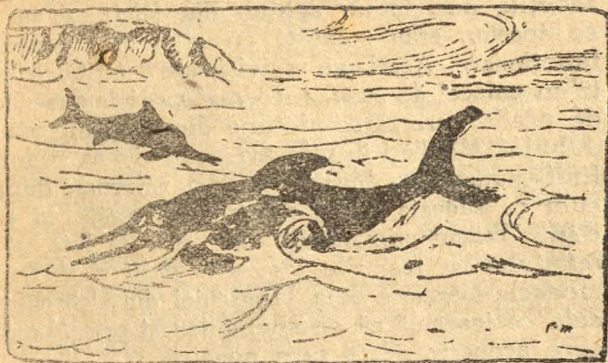
Fig. 4. Ichthyosaurus.

A. Reptile înotătoare . Intocmai precum chiar pentru un absolvent de liceu delfinii din Marea Neagră sunt la prima întrebare pești, așa de a-