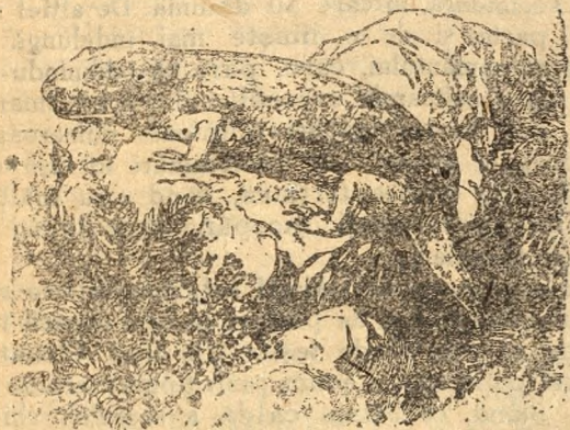
Fig. 2. O broască de demult.

ale celor de azi, era lung aproape de un metru. S'au găsit broaște din neamul sălămâzdrelor, deci care trăiau numai în apă, lungi de 1\frac{1}{2} m., iar altele de uscat lungi și de 2\frac{1}{2} m., în adevăr aproape cât lungimea unui bou de munte.