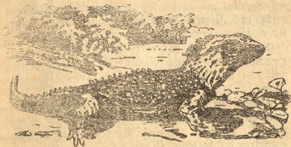
• Fig. 3. Șopârla din Noua Selandă.

Oseminte de reptile secundare, se găsesc în toate continentele și în destul de mare număr în cât lesne s'a putut reconstitui înfățișarea lor variată.