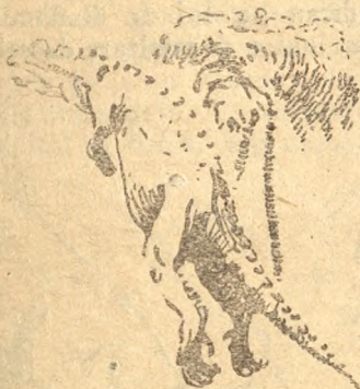
Fig. 6. Un dinosaur carnivor.

Dintre cele dintâi, mai cunoscute marelui public este Diplodocus , (Fig. 6), pentru că să socotea că e cel mai mare. Dela vârful botului până la al cozii măsoară 35 m., iar înălțimea lui e de 5 m. A fost restaurat complet pe sarma miliar-