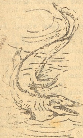
Fig. 5. Un Mosasaurus, șerpe urlaș înotător.

Înfățișarea reptilelor înotătoare era mult mai variată decât a mamiferelor înotătoare de azi.