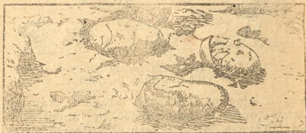
Fig. 10. Ouă de dinosaurieni, găsite în Tibet.

Variată și numeroasă era lumea dinosaurienilor, dintre care unii pășteau și pe la poalele Retezatului, căci scheletele lor s'au găsit prin pie-