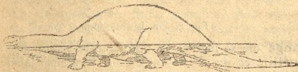
Fig. 7. Un Dinosaur uriaș. ( Brontosaurus ).

darului american Carnegie , iar în sala dela Muzeul Carnegie din Pittsburg, unde e expus această reptilă uriașă, s'a dat un banchet de 400 persoane, așa de mare ce e. Tot prin sprijinul lui Carnegie , după original s'au făcut tiparuri de