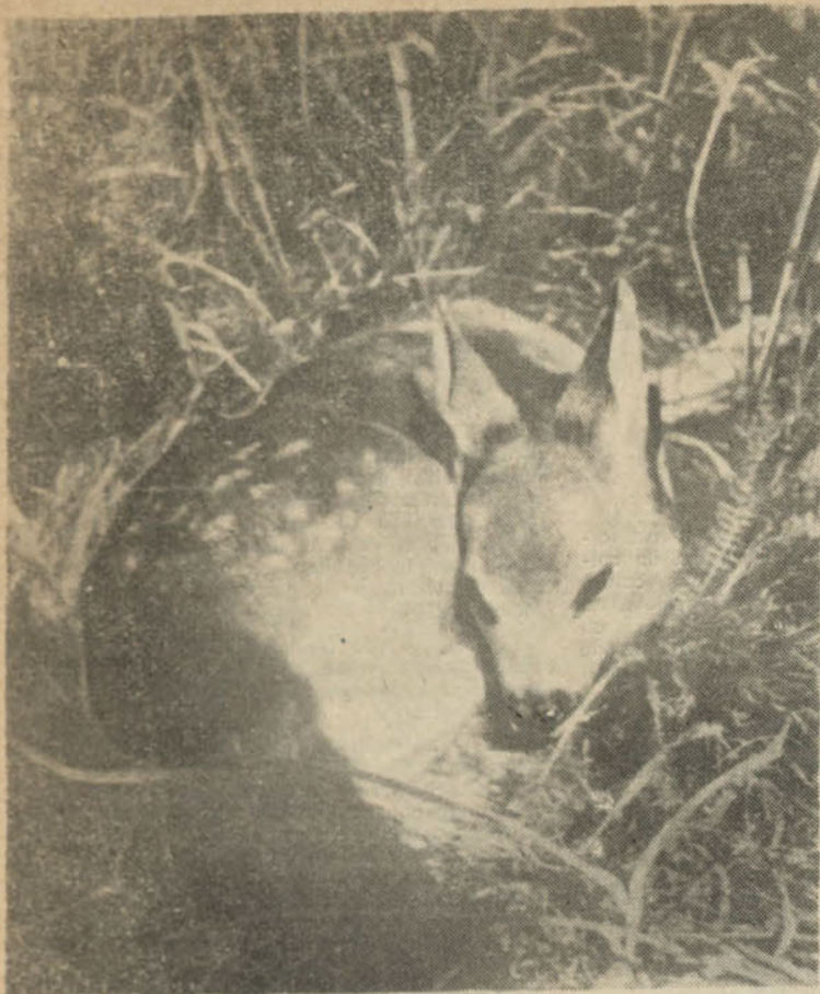
„Așa sta singură și murea, sub pletele mestecenilor cu trunchiuri albe”