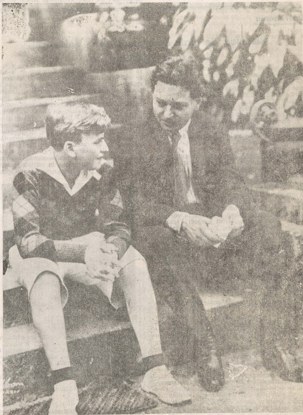
GEORGE ENESCU și YEHUDI MENUHIN (1931)