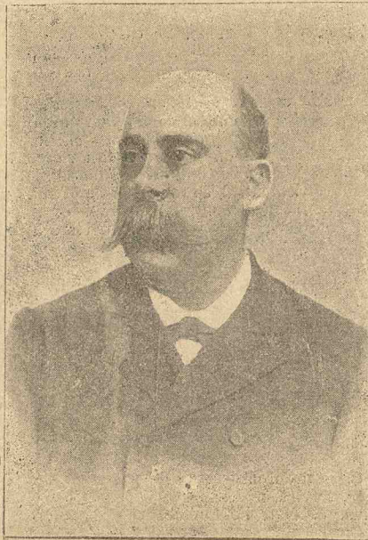
† EMILIO CASTELAR

Această favoare e numai până la 1 Iunie.