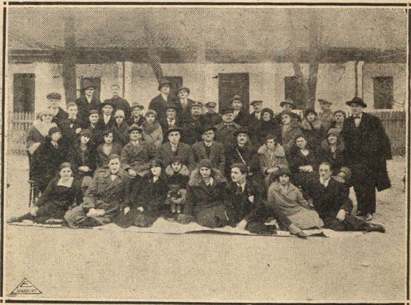
Corul „Astrei“ basarabene.