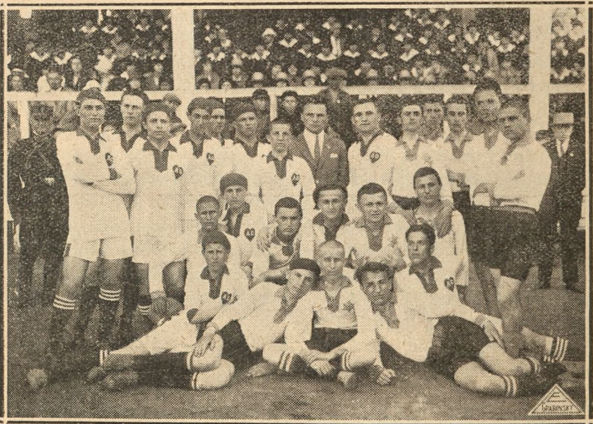
Echipa de oină a „Astreii“ basarabene și cea a liceului „Al. Donici“.

Multiplele insistențe puse pe lângă Regionala noastră, ne-au îndemnat să procedăm la înființarea unei secții de educație fizică.