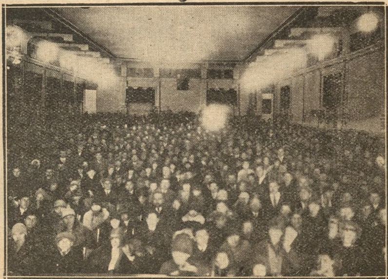
Publicul asistent la șezătorile „Astrei“ basarabene, Sala „Orfeum“.

Despărțământul județean din Cetatea-Albă dispune de un Cinematograf, care însă, din cauza crizei, abea își scoate cheltuelile.