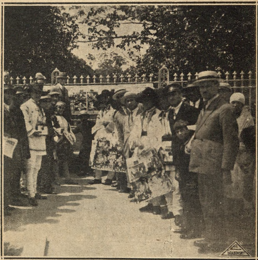
Echipa „Astrei“ basarabene, 1929.

Grilajul împrejmuit al statuei lui Ștefan cel Mare (Chișinău) este plin de afișe demonstrative expresive asupra alcoolismului. Public extrem de numeros se perindă neconținut, de dimineață până seara pe dinaintea afișelor, pe cari le citesc. Conferențarii „Astrei“ explică ravagiile alcoolismului.