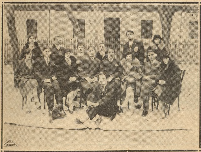
Echipa de teatru popular a „Astrei“ basarabene.

Necesitățile și tendințele culturale ale „Astrei“ basarabene i-au impus înjgheizarea unei echipe de teatru popular (vezi clișeul) care va fi un mijloc atrăgător și viguros pentru eficacitatea pro