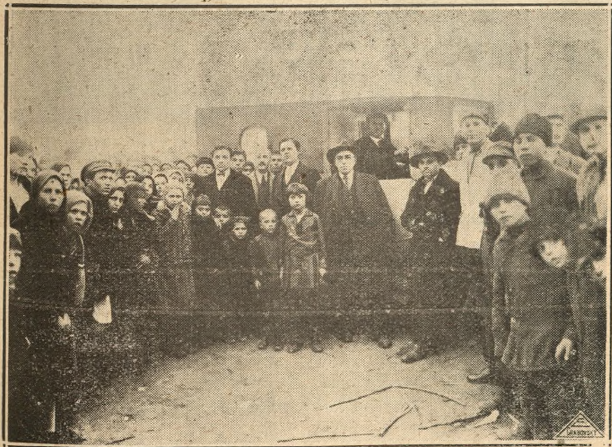
Șezătoare culturală organizată de „Astra“ basarabeană în mahalaua „Fru- mușica “—Chișinău, la 23 Martie 1930, la Școala Primară No. 18.