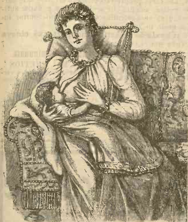
Cum trebuie să stea femeia când alăptează.

Nici-odată nu se va mai putea spune destul asupra acestui punct, căci îngrijirile ce trebuie date pruncilor sunt din cele mai grele. În fig. alăturată se vede cum doica sau mama trebuie să șe a dă cind alăptează pruncul. Mîna pe care o ține sub cap, negreșit trebuie să se sprijine de ceva ca s'o pōtă ține cît mai mult ast-fel fără a obosi.