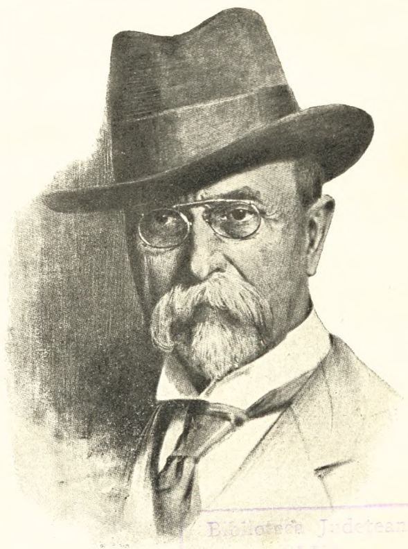
T. G. MASARYK