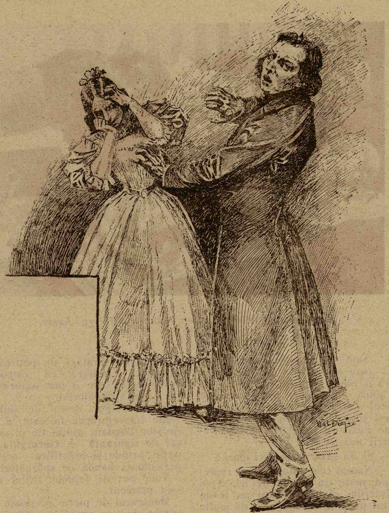
Inspăimântat, ascultam plânsul femeii, care-și strângea îndurerată capul între mâini

pe care o observasem întredeschisă. Rămăs singur, mi-am revenit puțin în simțiri și ducându-mă la ferestra am spart oblonul cu lovituri puternice. Apoi m'am îndreptat spre ușa pe care dispăruse arătarea.