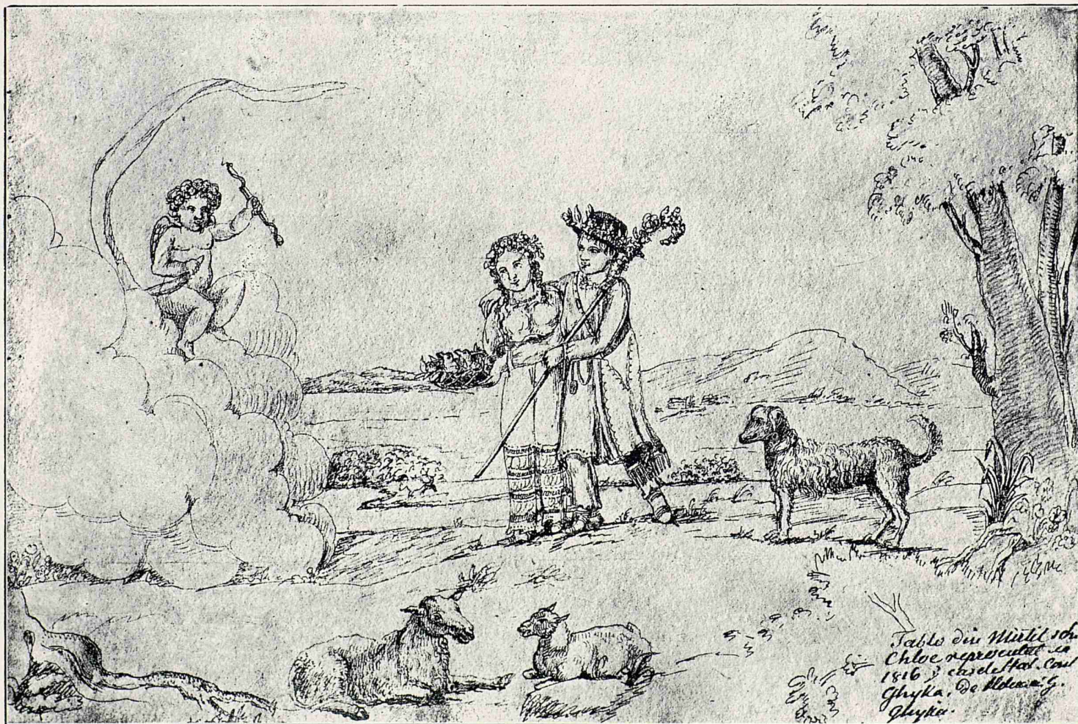
Mirtil și Chloe: schiță a lui Asachi după reprezentăția din Iași.