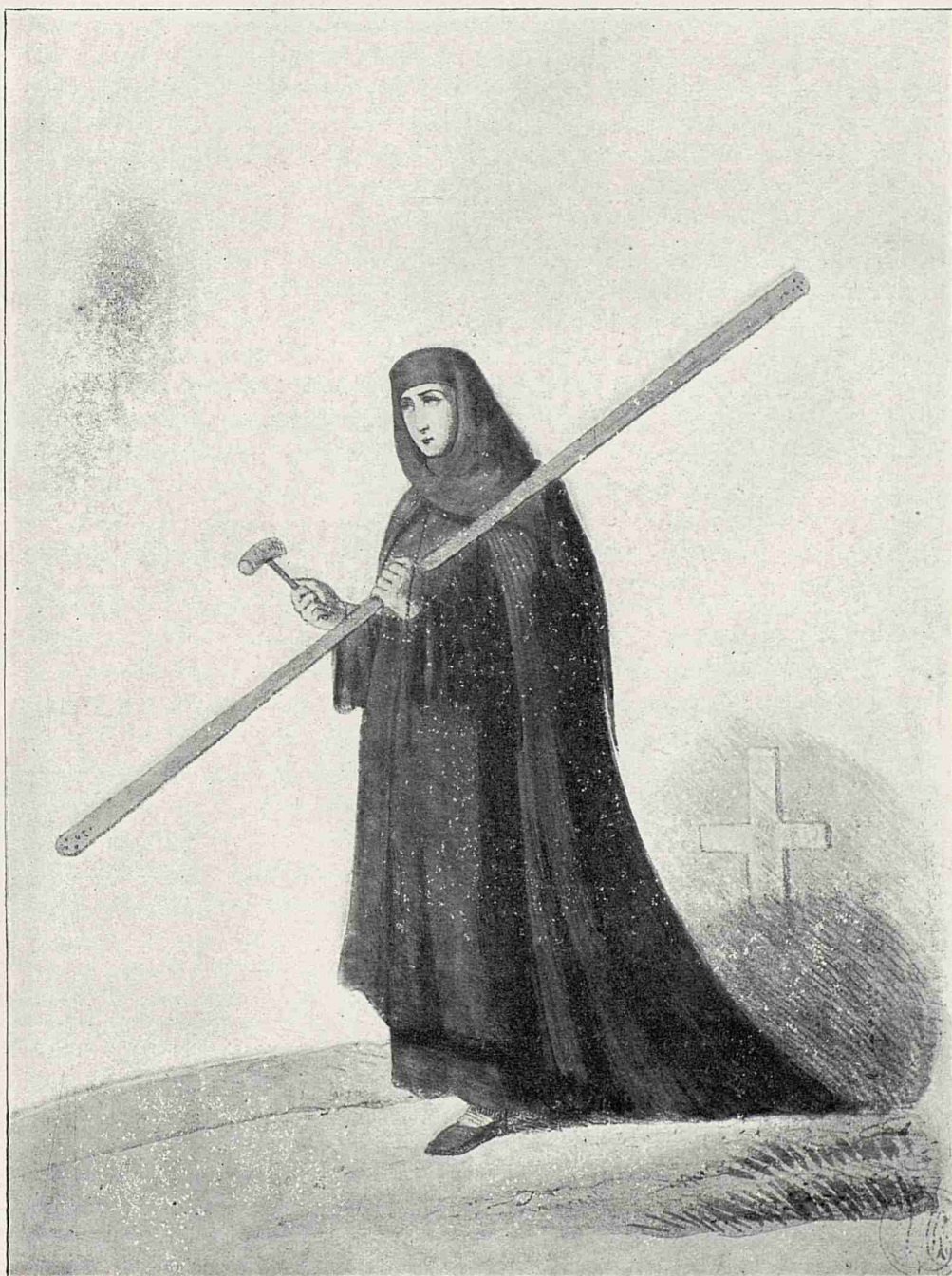
Călugăriță de Gheorghe Asachi.