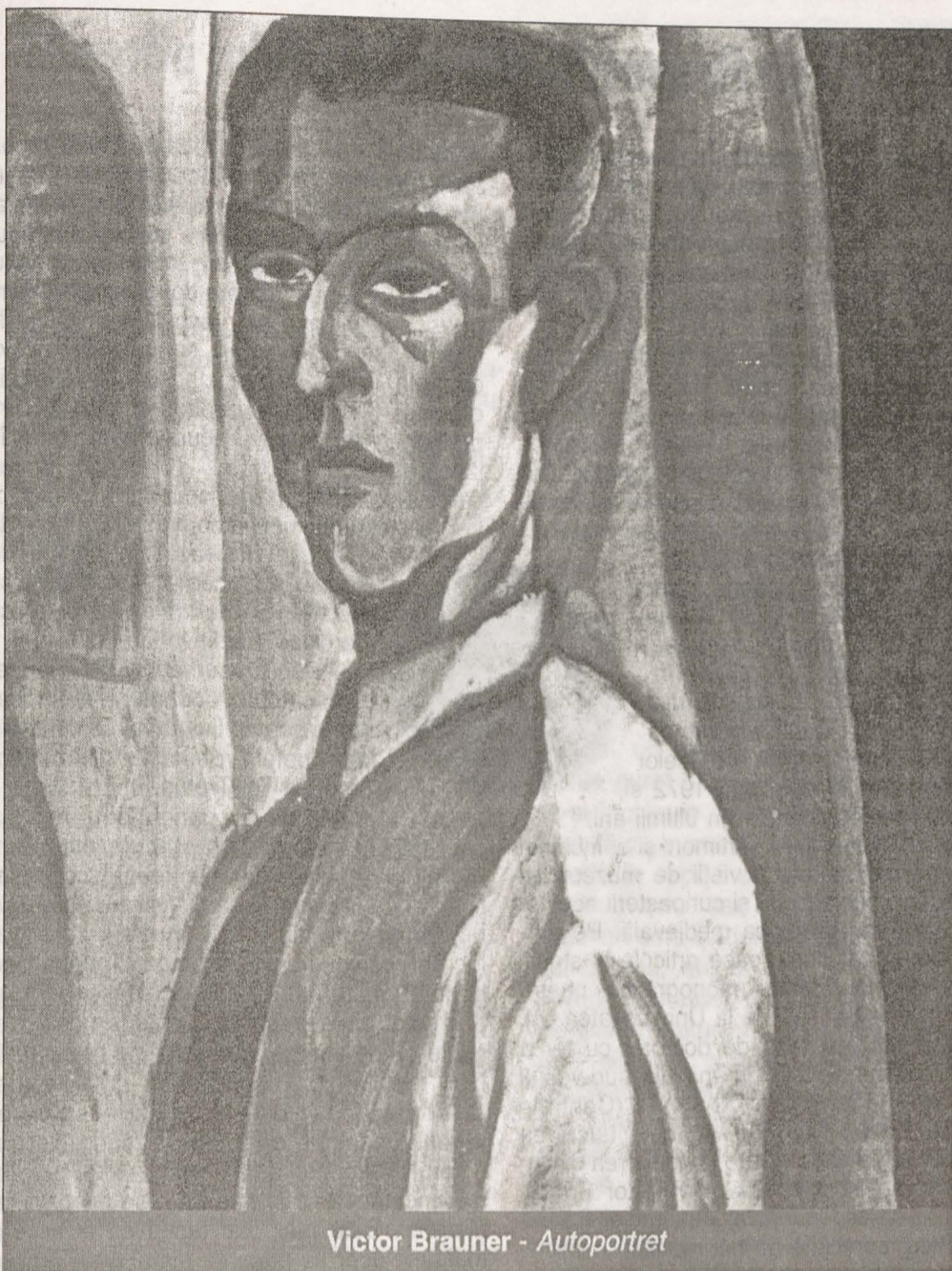
Victor Brauner - Autoportret