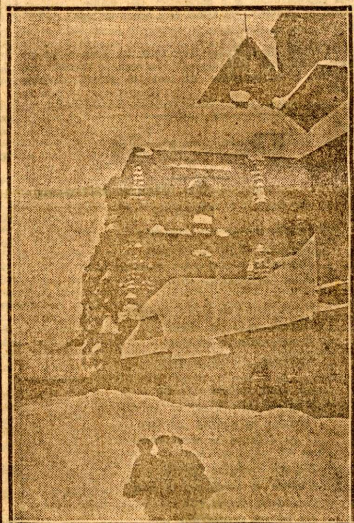
Biserica neagră din Erașov albită de viscol

„Sunt hotărât să închei aci cariera mea universală. Căci eu nu mă înțeleg ca profesorul unei materii...”