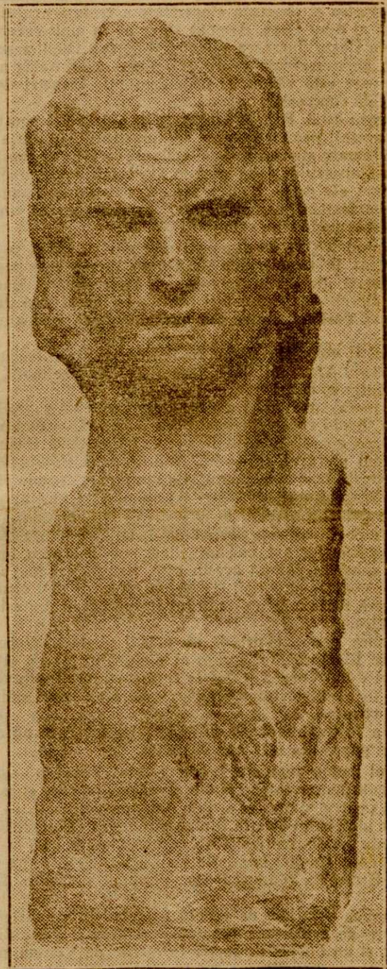
Paciurea. — Sfinxul

Panoul central este completat printr'un al doilea rând de tablouri așezat sub acestea și constituit din cea mai puternică lucrare a domnului Verona, un isprăvnic în haină roșie, viu și intens colorat, portret de un realism îndrăzneț și din trei peisajii ale d-lui Ștefan Popescu, lucrări de pictor maestru.