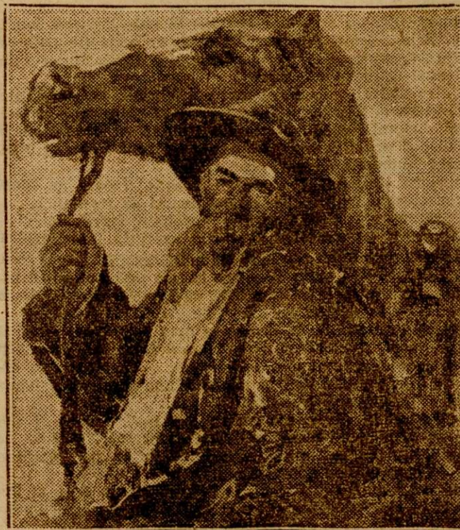
Verona. — Taraul

Spațiul rezervat tablourilor în sala exagonală este constituit din șase panouri. Panoul principal este ocupat de o pânză de mari dimensiuni a d-lui Verona, intitulată Giovinetta: sub umbratul unor livezi moldovenești, — în luna lui August — o tânărăcă tânără, în mișcarea costum pitoresc al Bucovinei, sălătoasă și surâzătoare sub mângăierea jucăușă a soarelui care pătrunde printre frunze și odășniară, brațele ei vântoase poartă cu eleganță un coș deschis tare și plin de mero roșii, de mere păguite și sărutate de soare.