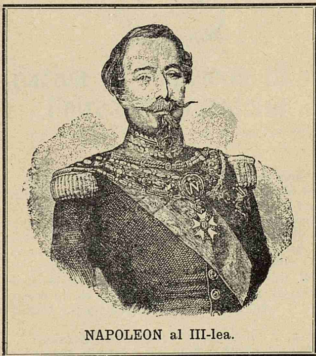
NAPOLEON al III-lea.