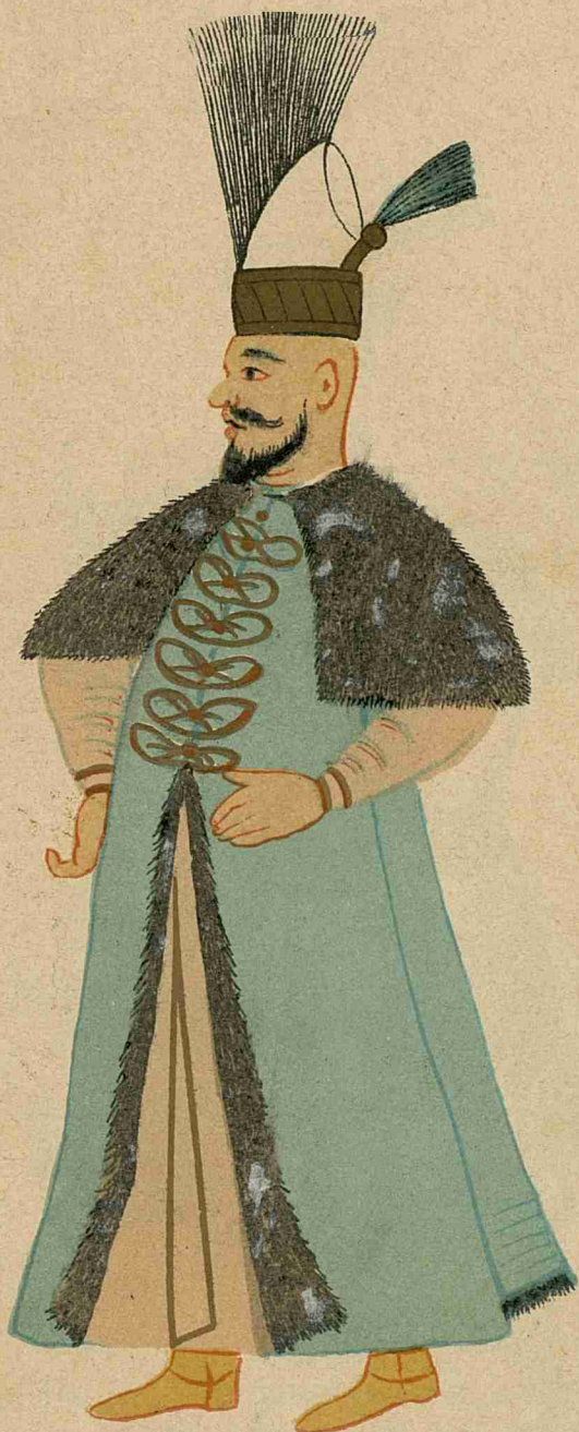
Domn al Munteniei sau al Moldovei (sec. al XVII-lea), în costum de audiență la Sultan, copiat după cod. it. monac. 251 a (iconogr. 352), p. 205 de profesorul St. Șoldanescu.