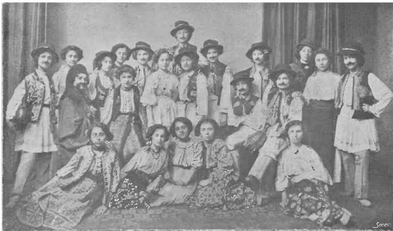
Ţ serbare a elevilor școlii Centrale