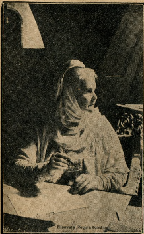
Elisaveta, Regina României