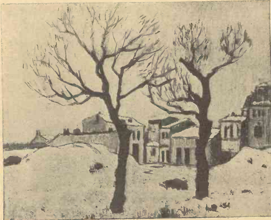
IARNA LA MAHALA

Oare vederea atâtor barete mici, albe, îl face pe cel care oficiază slujba să fie distrat? Nu e oare, mai degrabă, clopoțelul lui Garrigou, acel clopoțel turbat care se mișcă la piciorul altarului cu o înfrigurare drăcească, părănd